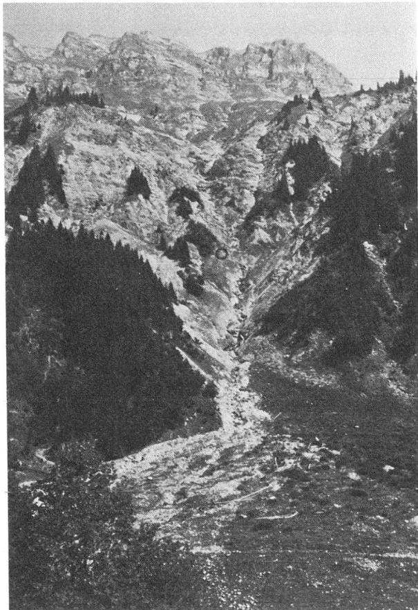
Die beiden Kreise deuten den Austritt der Quellen an.

Der bestellte Rutengänger zog dann eines Tages, begleitet vom Gemeinderat und einem Protokollführer von Seewis-Dorf, über Crestacalva, Gandawald, Stutz Richtung Ganey los. Auf diesem Marsch liess der interessierte Wasserschmecker immer wieder seine Rute spielen und mutete im Gehen eine ganze Anzahl kleine Was-