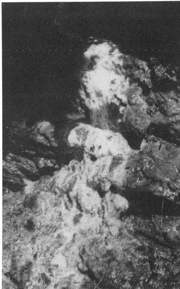
Die über den Felsen sich ergiessende Quelle.

Und nun nehmen wir die Abschrift von Pfarrer Saluz Werbeschrift zur Hand und sind nicht wenig überrascht, wie treffend dieser vor 350 Jahren die ganze Umgebung erfasst und beschrieben hat, denn er schrieb damals wörtlich: «Es finden sich ob dem Badehaus zwey reiche Quellen, so aus einem lebendigen Fels hervortreten und nur wenige Klafter weit von einander entfernt. Deren eine ein überaus subtiles, schier volatisches, liebliches Wasser ohne Säure gibt, so recht Alcalinisch Balsamisch, darby man schönstem Marchafita aurea oder Goldkiess (Katzengold) findet, welchen die Alchimisten eyfrig suchen, behauptende, dass solches der Same des Goldes seye.