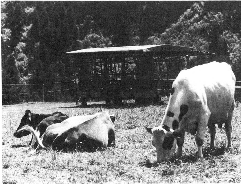
Fahrbarer Melkstand. Die Versuchskühe werden stets im Freien gemolken.

beitskräften geführt. Die wissenschaftlichen Arbeiten werden durch permanent oder periodisch stationierte Assistentinnen und Assistenten erledigt. Organisatorisch ist der Betrieb auf Crap Alv dem Versuchsgut Chamau zugeordnet. Bis vor zwei Jahren war nur Jungvieh gesömmert worden (50 bis 70 Versuchstiere aus der Chamau und 100 bis 120 fremde Aufzuchtrinder). Seit zwei Jahren ist die Zahl der eigenen Sömmertiere auf Kosten der fremden angewachsen, da nun auch Kühe in die Alpnungsversuche einbezogen wurden.