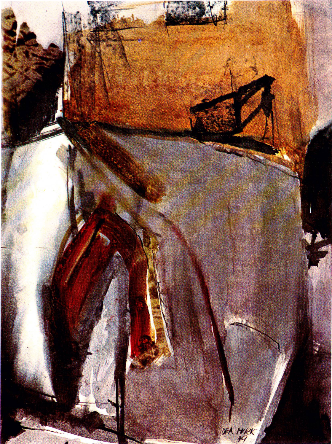
Dea Murk: Malerei, Öl 1981/1982, 48x63 cm