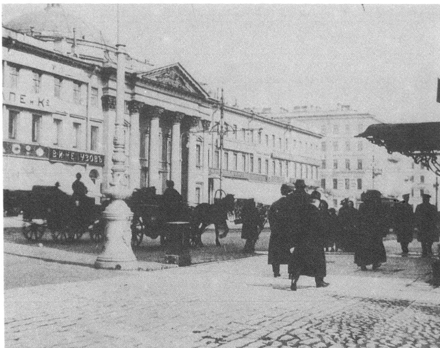
Der Häuserkomplex der holländisch-reformierten Kirche am Nevskij Prospekt Nr. 20-22 um 1910: links das Café «Dominique» (Riz à Porta) und rechts außen die «Isler'sche» Buchhandlung.