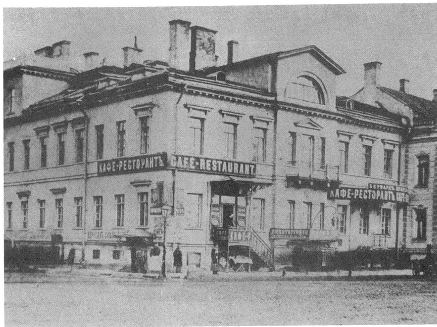
Das Café-Restaurant Bernhard auf der Vasilij-Insel um 1900: heute Café «Lukomor'e».