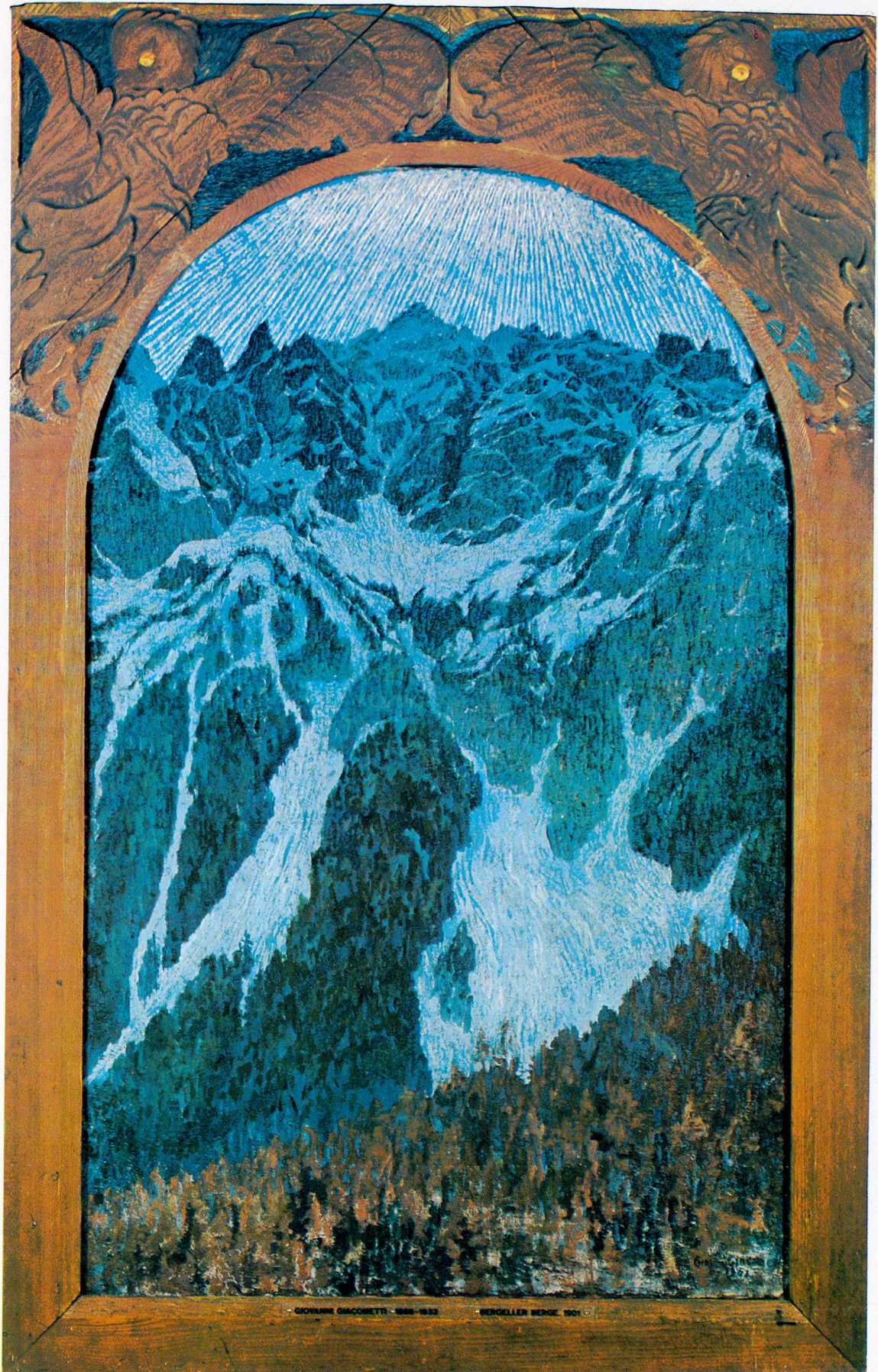
Giovanni Giacometti: Bergeller Berge, 1901. Öl auf Leinwand. 137,5 x 86,5 cm Bündner Kunstmuseum, Chur