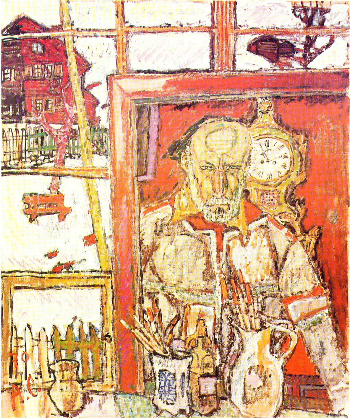
Alois Carigiet: «Selbstporträt»