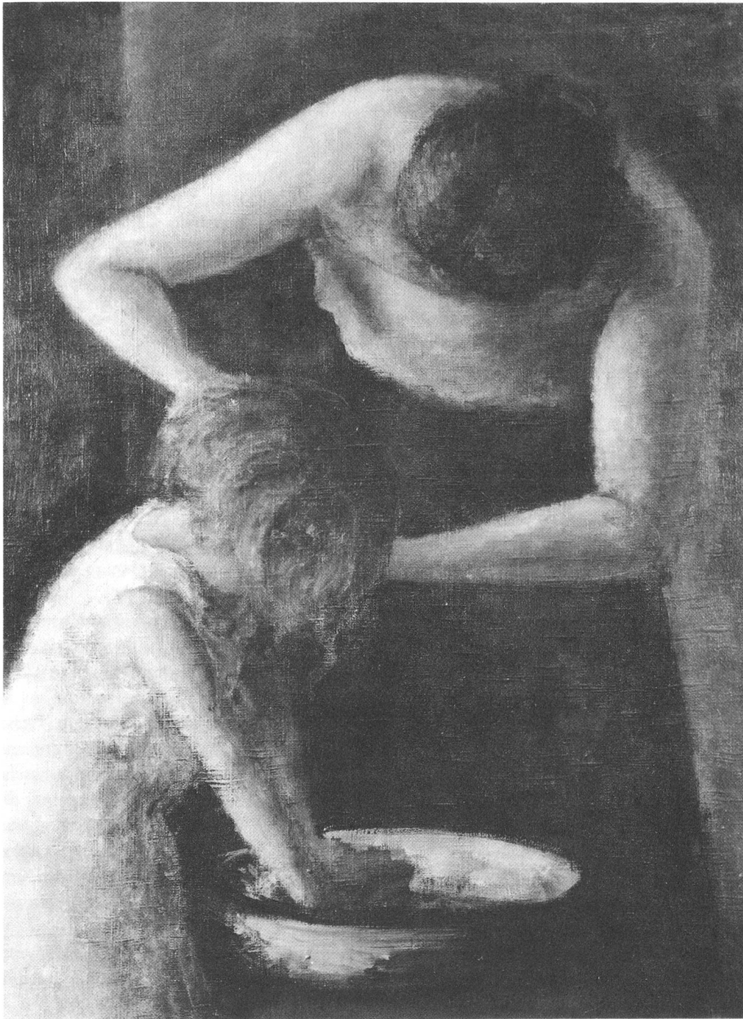
Kopfwaschen. 1935. Öl. 99 x 72 cm