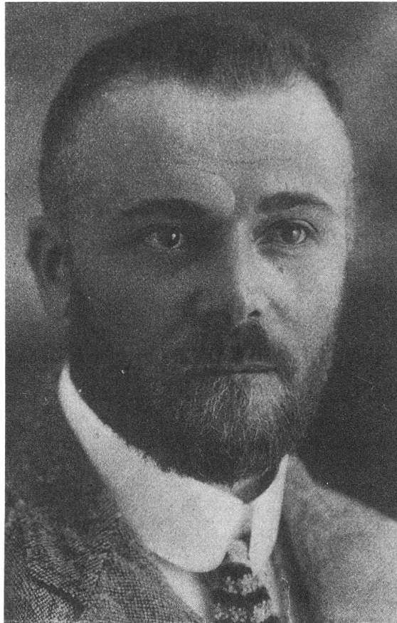
Augusto Giacometti 1877–1947

Diese beiden Gestalten werden in der christlichen Kunst oft und gern miteinander dargestellt, es sind dies Esther und Judith. Dabei wird Judith unter dem Gesichtspunkt der Keuschheit und des Starkmutes von der Kirche als Vorbild Mariens betrachtet. Wir sehen sie hier mit dem Haupt des Holofernes. Esther mit der Blume in der Hand, dem Zeichen ihrer Unberührtheit, als königliche Braut (Esth. 2,3).