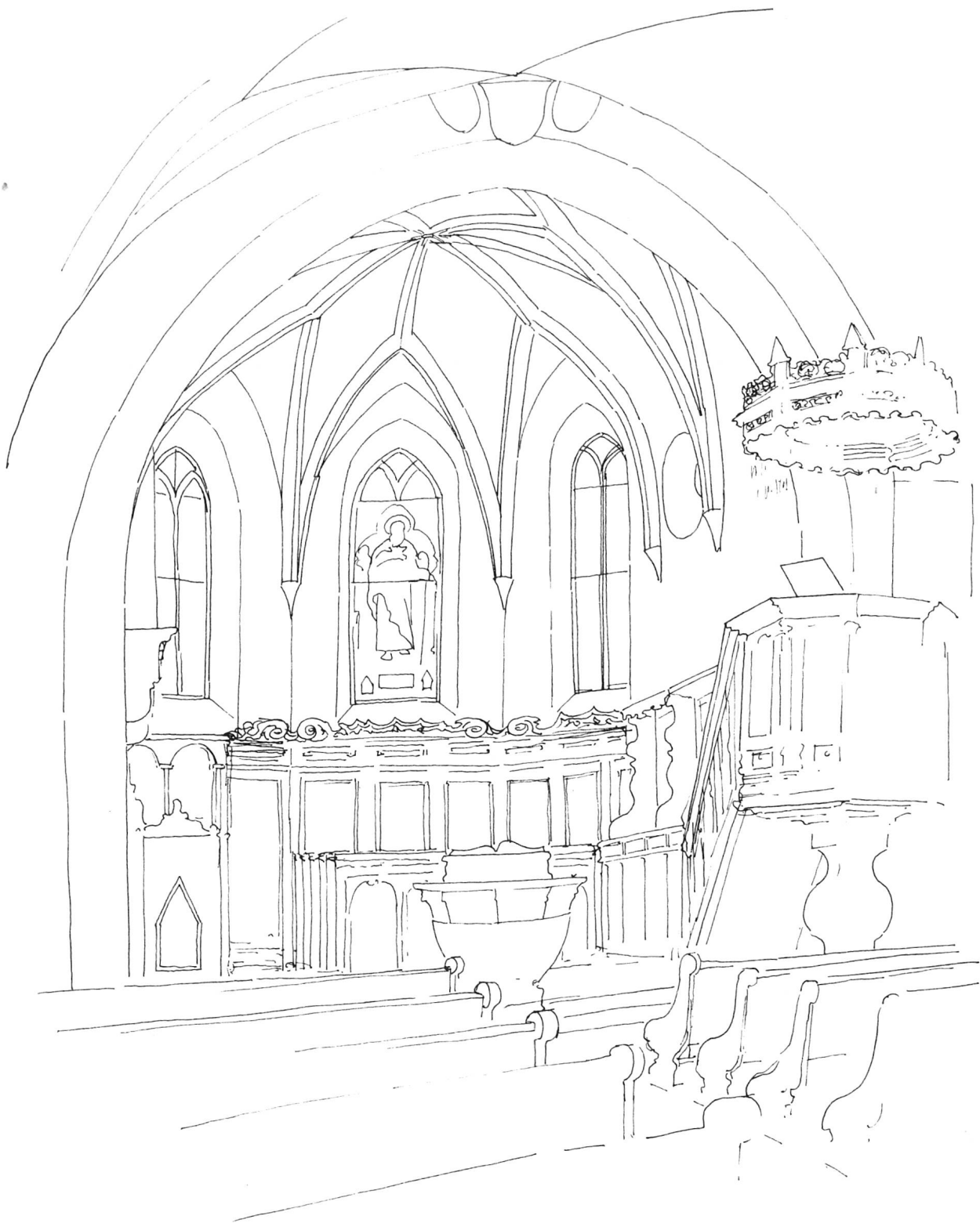
Federzeichnung von Vreni Zinsli-Bossart: Kirche Langwies