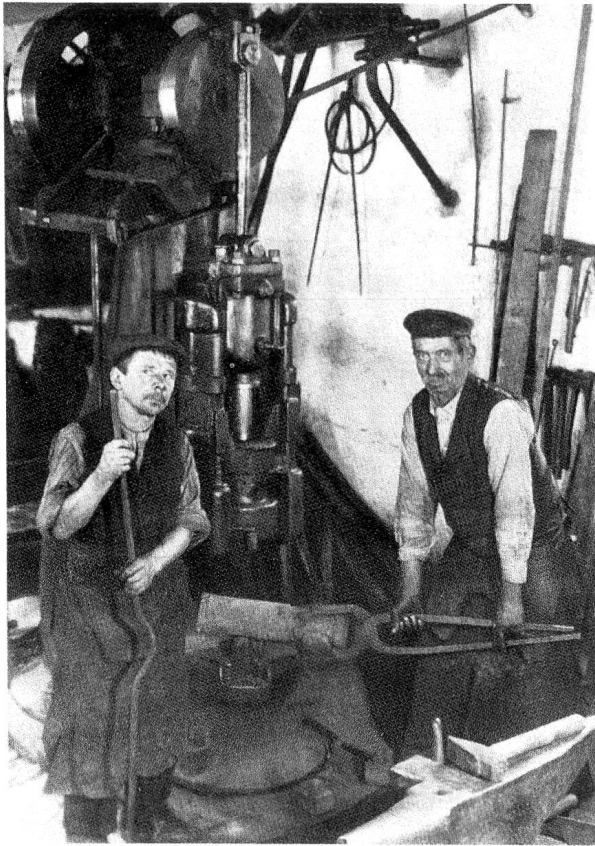
Zwei Arbeiter der Hammerschmiede Versell.

Prellstock, auf dem Boden, geschlagen, so dass er, durch das Drehen des Wellbaums frei geworden, nach oben schnellen konnte. So erhielt der fallende Eisenhammer die Wucht für den Schlag auf das ihm unterlegte Schmiedestück.