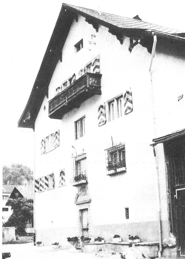
Das Obere Deflorinhaus.

Interessant ist die Lage der Kirche, denn sie steht leicht erhöht mit Sichtkontakt zu den Kirchtürmen der umliegenden Dörfer. Der romanische Turm gehört zur ursprünglichen Kirche, er steht gleichsam als fassbarer Megalith in der Landschaft. Eine Glocke stammt angeblich von der Jörgenburg, eine andere verbrüderte hängt heute in Vuorz. Der Überlieferung gemäss sollen beim ersten Kirchbau in der Nähe des Dorfbaches die gesetzten Steine jeweils fortgerollt sein, was als schlechtes Zeichen gedeutet wurde, darum erbaute man die Kirche am heutigen Platz. Im Jahre 1633 hatten dann Kapuziner die verwahrloste Kirche neu gestaltet. Noch bei ihrer Ankunft mussten die tüchtigen Patres im Freien unter Nussbäumen übernachten bis ihre Arbeit anerkannt wurde. Die Kapuziner wirkten den Umständen der Zeit entsprechend von 1616–1633 in Rueun, deshalb auch der italienisch geprägte Charakter der Kirche.