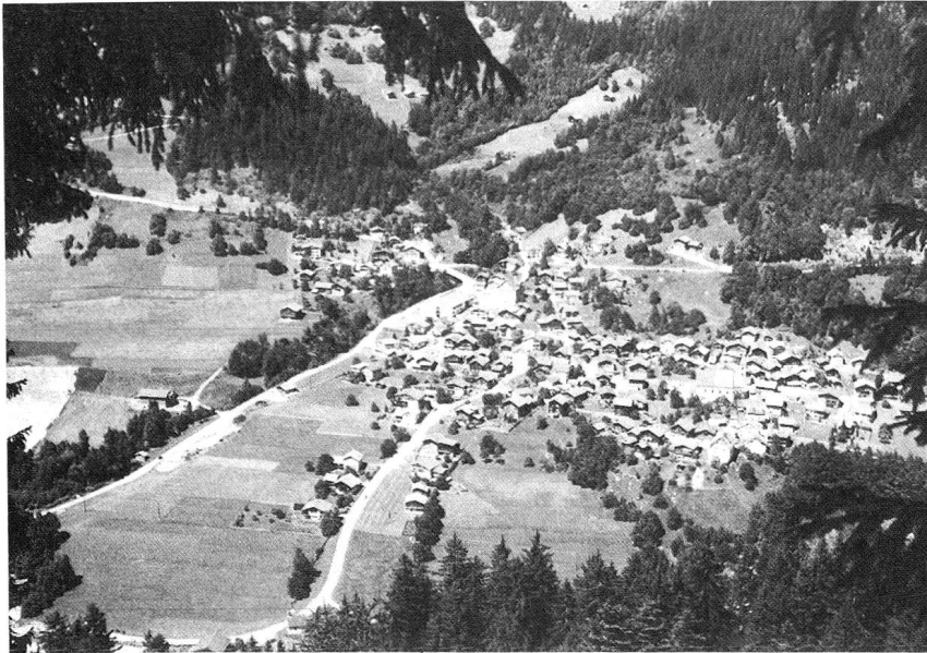
Blick von Flond auf Rueun.

dem Rhein ausweichend, auf die Anhöhe von Waltensburg, dann nach Brigels und weiter Richtung Disentis.