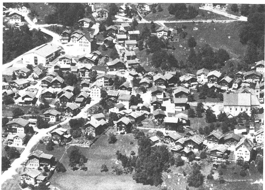
Blick von Chislun bei Flond auf Rueun (links oben Brücke über Rufe).

Ort («Agrum trans Flumen») südlich des Rheins erwähnt, heute in einem Gebiet gelegen, das in jüngster Zeit durch die Aufschüttung und Planierung von Ausbruchmaterial des Panixer-Druckstollens aufgefüllt und zum Zwecke der Rheinkorrektur erheblich verändert wurde. Noch heute besitzt die Gemeinde in der Nähe bei Pardella und der nahen Bahnstation Land. Aus dem Tello-Testament geht zudem hervor, dass zu jener Zeit vorzugsweise auf den geschützten Talflanken gerodet und gesiedelt wurde. So führte der alte Talweg von Ilanz, wo eine Brücke oder Furt bestand, längs der linken Talseite nach Rueun, von hier aber,