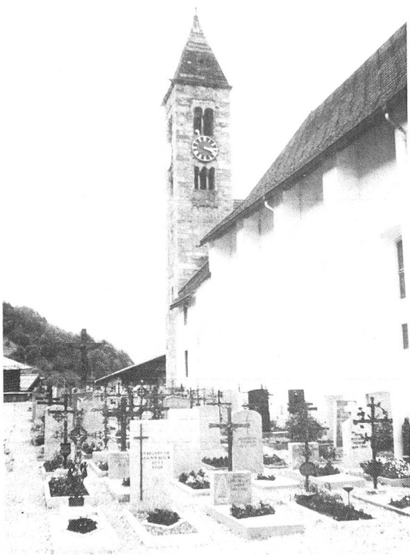
Romanischer Turm der St. Andreaskirche.

mischen Susten errichtet, dies auch an der Lukmanierroute.