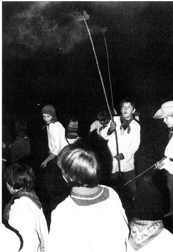
An langen Ruten befestigt werden die Scheiben durch schnelles Kreisen vollständig zum Glühen gebracht.

Lässt sich über Bedeutung und Herkunft des Scheibenschlagens wenig sagen, so sind andere Bereiche dieses Brauches wissenschaft-