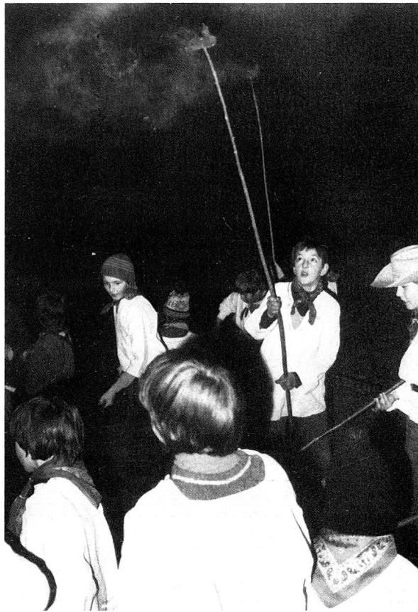
An langen Ruten befestigt werden die Scheiben durch schnelles Kreisen vollständig zum Glühen gebracht.

Lässt sich über Bedeutung und Herkunft des Scheibenschlagens wenig sagen, so sind andere Bereiche dieses Brauches wissenschaft-