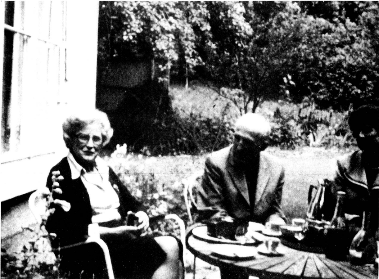
Besuch Peyers am Prasserieweg, Juli 1976.

schwarz stehen die Tannen am Wege. Es regnet und bis am Morgen wird tiefer Schnee auf den Bergen liegen. Im Eilschritt erreiche ich den letzten Zug und bin überglücklich, Zeuge dieser Naturverwandlung gewesen zu sein. Mein Bild allerdings entspricht nicht meinem Traum. Vielleicht kann ich es im Atelier, aus der Erinnerung, noch etwas weiter bringen. Aber nächstes Jahr, Ende Oktober, da wird es bestimmt gelingen!»