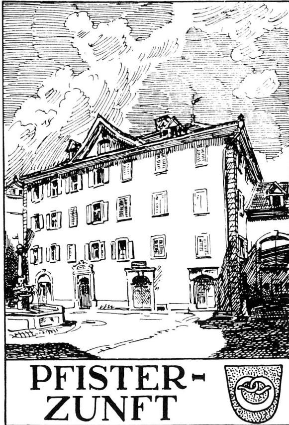
Zeichnung von Otto Braschler in: E. Piaget und E. Hügli, 100 Jahre Handwerker- und Gewerbe-Verein Chur 1842–1942, Chur 1942, S. 29.

war, vollzogen sich die politischen Neuerungen in unserem Gebiet «naturgemäss» mit einer gewissen Phasenverzögerung. Für Stadtpräsident Mohr «war Chur das letzte Bollwerk der Zünfte im Schweizerland», und im weiteren interpretierte er die Geburtsstunde des Churer Gewerbevereins wie folgt: