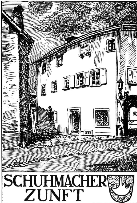
Zeichnung von Otto Braschler in: E. Piaget und E. Hügli, 100 Jahre Handwerker- und Gewerbe-Verein Chur 1842–1942, Chur 1942, S. 13.

Staat und Wirtschaft oder konkreter, kommunaler: Stadt und Gewerbe, beide herausgefordert durch Beschäftigungseinbrüche, vor allem in der Baubranche. Im Staatsarchiv ist die Fortsetzung nachzulesen: Angesichts drohender Arbeitslosigkeit beschlossen die damaligen Behörden, für einmal konjunkturpolitisch initiativ zu werden, und zwar mit einem Arbeitsbeschaffungs-Massnahmen-Paket, mit vorgezogenen Investitionen und Sanierungsprogrammen. Kurz: man wollte sich im Rathaus gezielt und bewusst antizyklisch verhalten. Nach engagierten Beratungen zwischen Stadtrat und Geschäftsprüfungskommission wurde diese Aktion im Gemeinderat einstimmig beschlossen. Das war ein Resultat guter Zusammenarbeit innerhalb und zwischen den Behörden.