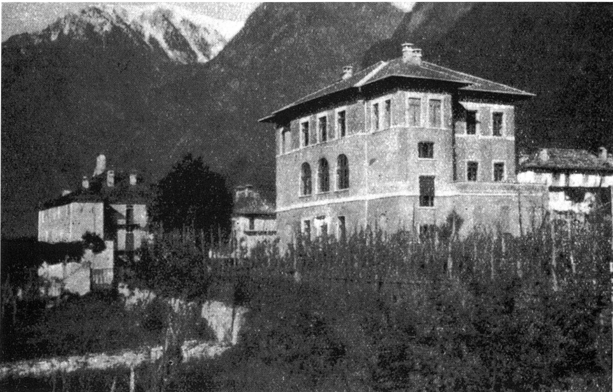
Scuola Reale e Prenormale. Aus einem Prospekt des Erziehungsdepartements des Kantons Graubünden um 1928 (STAGR XII 5b).

Die Schulverhältnisse in der Moesa wichen im letzten Jahrhundert von der Entwicklung in den übrigen Talschaften Bündens stark ab (s. Metz, Herbartianismus, 1992, 518ff.). Im Unterschied zu den anderen Inspektoratsbezirken war der Lehrberuf im Misox und Calancatal überwiegend ein Frauenberuf: auf sechs Lehrerinnen kam ein einziger Lehrer (2. Jb. des Bündner Lehrervereins 1884/85, S. 41). Den Gründen für diese Tatsache müsste man in einer Spezialstudie nachgehen: Fanden die Männer ausserhalb