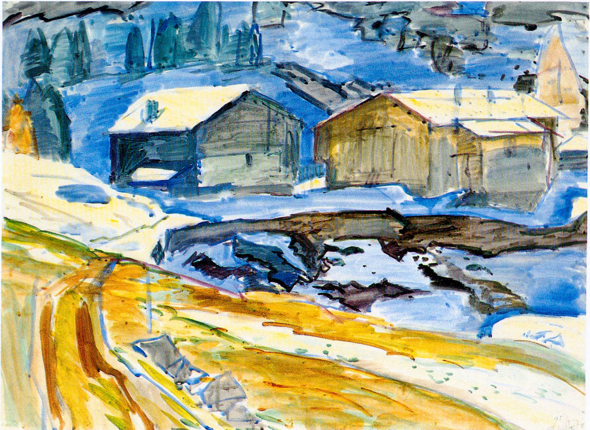
Tafel 2: Georg Peter Luck, «Tage danach», Aquarell, 1978.