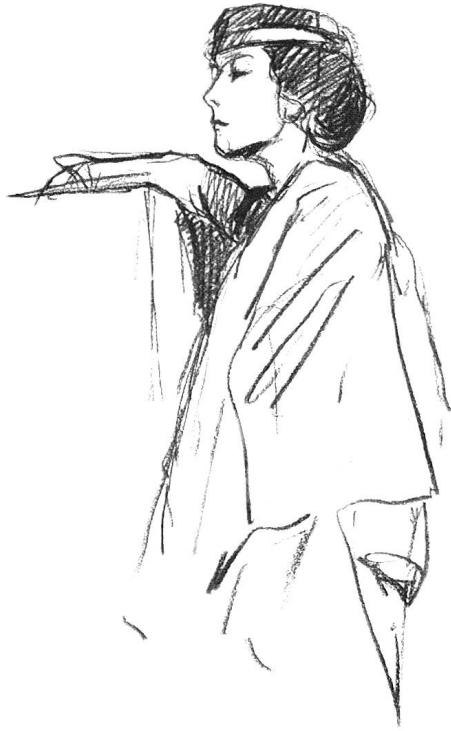
Aus dem Skizzenbuch von Maria Bass.

weilt, tut sie ihren Unmut kund: «..hier steckt man zwischen lauter geschminkten und gepuderten Wesen, die mir auf die Nerven geben...». Sie zieht das Reisen vor, studiert die alten Meister in Italiens Museen.