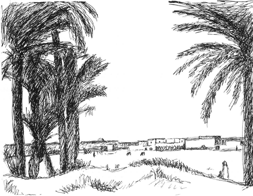
Maria Bass: Tunisreise, Tuschzeichnung.

bezieht die «Mama» sehr innig und um Teilnahme bemüht, in alle ihre Angelegenheiten und Entscheidungen ein.