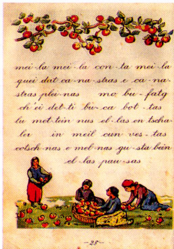
«Meila», La Fibla romontscha 1921, p. 28