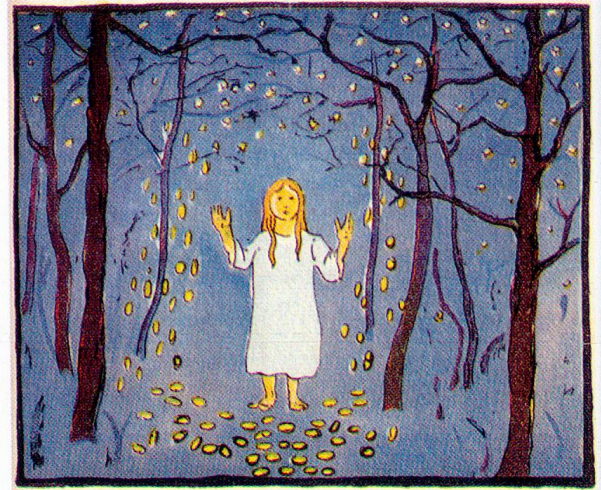
Giovanni Giacometti, Illustration «Sterntaler», 12,0 x 14,5 cm Bündner Fibel von 1921, S. 57