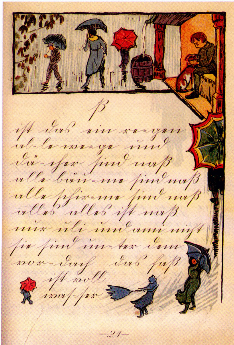
«Ist das ein Regen», Bündner Fibel 1921, S. 21

die Heimat, ihre Natur und Lebewesen kennenzulernen. Schliesslich ist der ästhetischen Raumgestaltung Aufmerksamkeit zu schenken: «Nicht Monumentalbauten, die die Seele des Kindes erdrücken, sollen entstehen, sondern sonnige, luftige Schülerwohnungen, in denen die Schönheit Raum hat.» 29