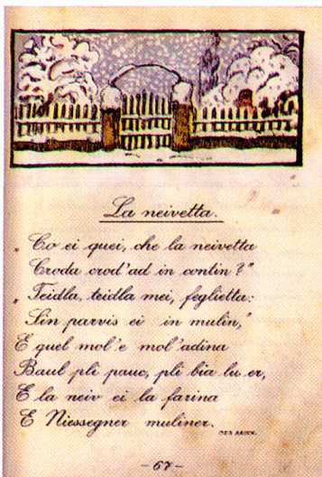
«La neivetta», Fibla romontscha, 1921, p. 67