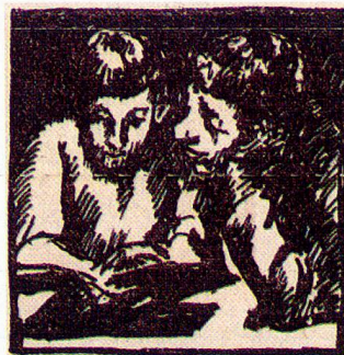
Lesende Kinder, Bündner Fibel/ Fibla romantscha 1921 (Einband)

Die Frage einer Illustrierung der bündnerischen Lesebücher gewann unter der Lehrerschaft erst zu Beginn des 20. Jahrhunderts ein ausgeprägtes Interesse. Man hatte vereinzelt schon im 19. Jahrhundert die Lesebücher illustriert. Besonders attraktiv bebildert war der «Cudisch de lectura» mit der Sigisbert-Sage, den die Oberländer Romanen 1899 in eigener Regie aus Protest gegen den Robinson des staatlichen Lesebuchs der 2. Klasse herausgebracht hatten 6 . Die Kritik an der ungenügenden Illustrierung der Lesebücher entwickelte sich bezeichnenderweise zu einem Zeitpunkt, als ein jahrzehntlanges, unerfüllbar scheinendes Ziel erreicht worden war: Innerhalb eines Jahrzehnts, zwischen 1895 und 1905, schaffte es das Erziehungsdepartement gemeinsam mit Lesebuchredaktoren, dass sämtliche Schulen des dreisprachigen Kantons flächendeckend