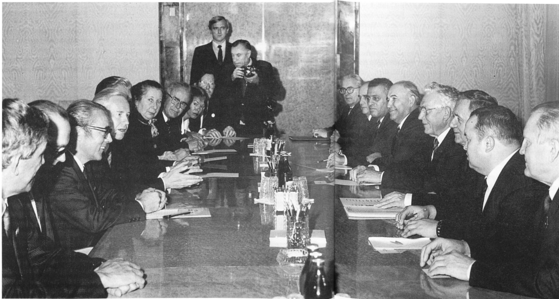
Gespräch zwischen Parlamentariern in Moskau 1986: Links die schweizerische Delegation, rechts die sowjetrussischen Gesprächspartner.