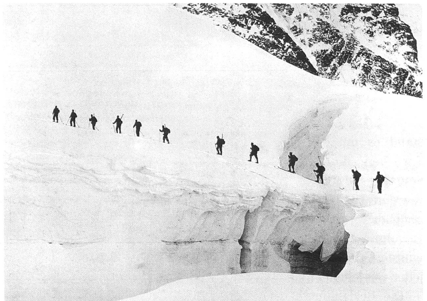
In den Cambrenabbrüchen, Foto rückseitig als Ansichtskarte bedruckt mit dem Zitat: «Indem wir den Sinn für die Bergwelt und die Gebirgstüchtigkeit fördern, stärken wir gleichzeitig unsere Kräfte zur Abwehr» (Armeebefehl des Generals vom 1. August 1941), rückseitig abgestempelt: «Erinnerungsfeier Piz Palü-Besteigung + Ski Kp Geb Br 12 + Pontresina 3. März 1939»

war schon zum Abmarsch bereit. Ihr waren nur vorzüglich trainierte Leute zugeteilt, denn wie schon der Name sagt, hatte diese die Spur für die nachfolgende Truppe vorzubereiten. Diese muss auch in Bezug auf Lawinengefahr, Eis- und Steinschlag einwandfrei gezogen werden. Punkt 02.00 Uhr marschierte die erste Kolonne, der auch ich zugeteilt war, von Pontresina ab. Es war kalt und der Himmel wolkenlos. Lautlos gleiteten wir das Val Bernina hinein bis zum Morteratschgletscher. Das verwendete Steigwachs hatte sich bis jetzt bewährt. Doch bald wurde die Temperatur zu tief und das Gelände zu steil, weshalb wir die Felle anschnallen mussten. In gleichmässigem Tempo stiegen wir den Morteratschgletscher bis zur Isla Pers hinauf, wo ein längerer Marschhalt mit Verpflegung eingeschaltet wurde. Inzwischen war es Tag geworden.