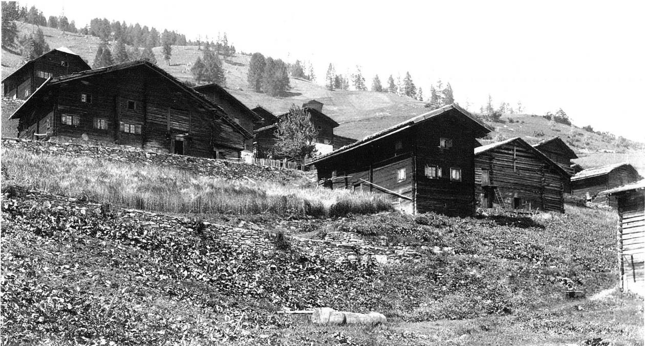
Mutten um 1880.