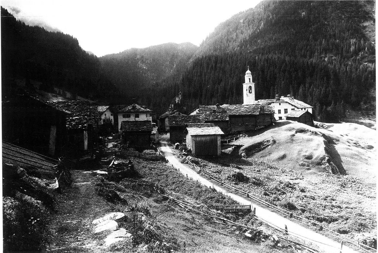
Innerferrera im 19. Jahrhundert.