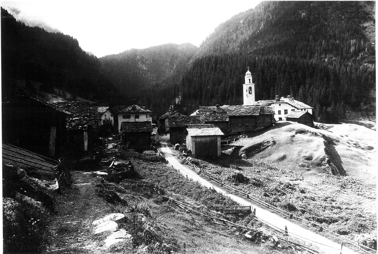
Innerferrera im 19. Jahrhundert.