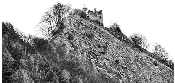
«Die Wacht am Rhein» – Burg Lichtenstein ob Haldenstein.

Blickt man vom unteren Calanda oberhalb Haldenstein nach der Burgruine Lichtenstein, erscheint ein Mauerstumpf auf der Zinne wie ein Soldat mit Helm und Gewehr bei Fuss, hoch über dem Rhein, der sich an die Bergflanke anschmiegt. Unvermittelt fällt einem das martialisch patriotische Lied ein, mit dem Deutschlands Soldaten in den Ersten Weltkrieg zogen: «Lieb Vaterland magst ruhig sein, treu und fest steht die Wacht am Rhein.»