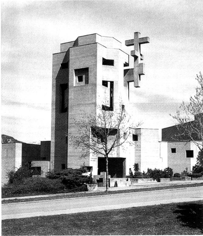
Die Heiligkreuzkirche in Chur.

Es ist rund um die Uhr präsent. Unser Turmkreuz ist nicht bloss Wahr-Zeichen nach aussen, es symbolisiert auch, dass jedes Kreuz eine Art Kristallisationspunkt von Leid und Tod in aller Welt darstellt, gewissermassen ein Empfangsgerät, das Notsignale «rotierender» Menschen aufnimmt.