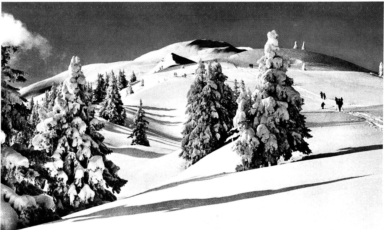
Am Dreibündenstein.

Was ist Zufall? Das, was uns eben zufällt. Das macht wahrscheinlich das Schönste, aber auch das Schwerste und zweifellos das Wichtigste im Leben aus. Vieles fällt uns auch zu, weil wir es anziehen. Was nicht alles leichter macht, aber dafür spannender.