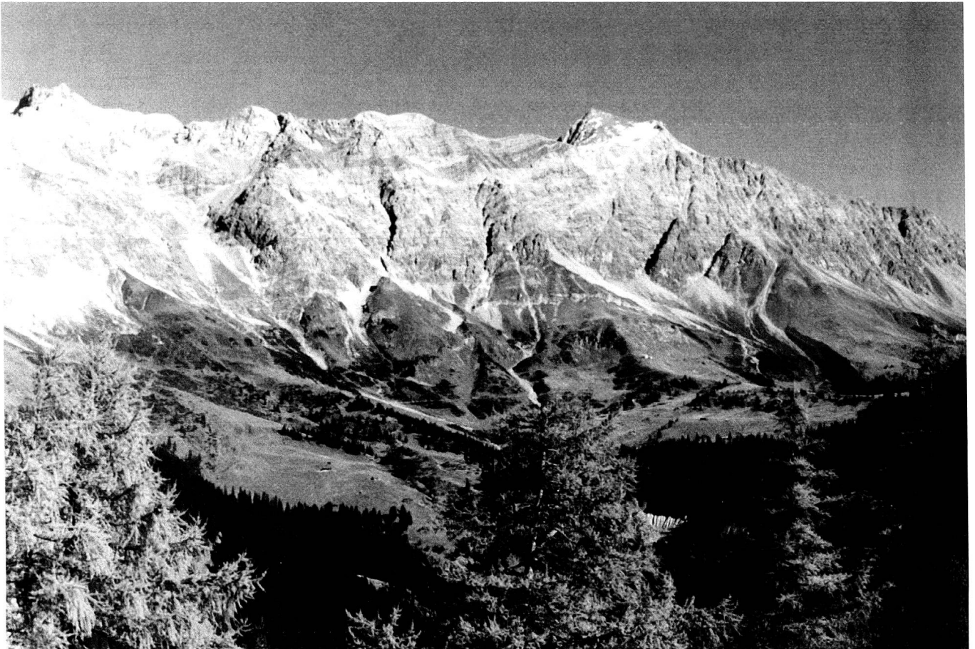
Schesaplana. (Foto Christian Fausch, Seewis i. P., Herbst 1971)

quert die Route eine tiefe Felsspalte. Dabei sind die Wegzeichen ganz nahe an den beiden Spaltenkanten angebracht. Eine akrobatische Leistung ist nicht erforderlich, aber ohne gezielten Sprung kommt man nicht hinüber.