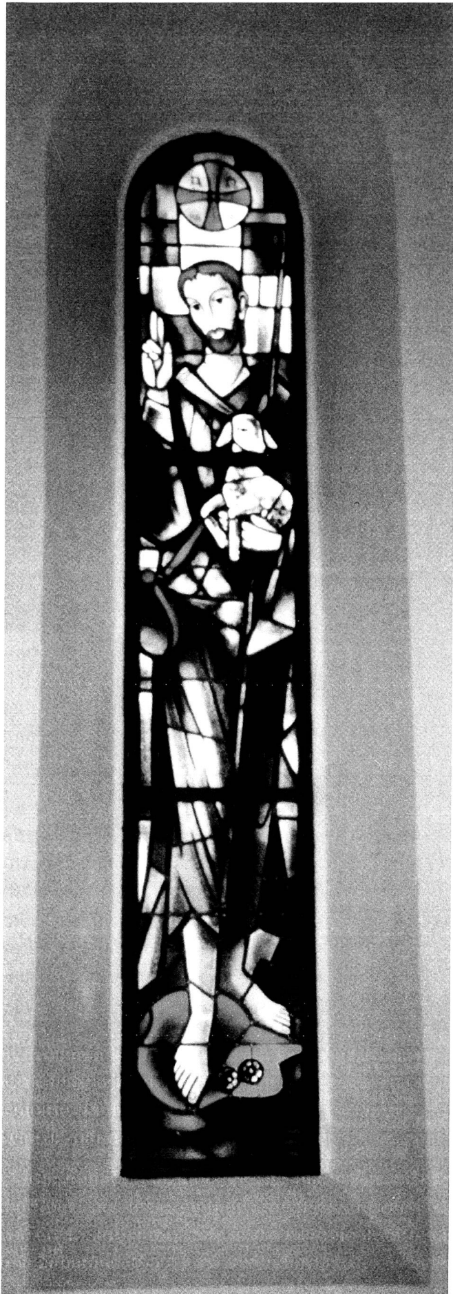
Der grüne Christus, Glasfenster in der Kirche Jenins.

Im Prättigau rieben sich die Konfessionen wie nirgends sonst in Graubünden: Reformation, Rekatholisierungsversuche mit österreichischer Intervention, begleitet von der Mission des Fidelis von Sigmaringen zur Zeit der «Bündner Wirren» und Abwehr der Gegenreformation. Die Bevölkerung war traumatisiert und konfessionell besonders empfindlich. An der 1837 gegründeten «Evangelischen Mittelschule Schiers» prangt weit sichtbar das Pauluswort, das oft das Innere evangelischer Kirchen ziert, wohl auch mit einer gewissen anti (päpstlich)-katholischen Spitze: «Einen andern Grund kann niemand legen ausser dem, der gelegt ist: Jesus Christus.»