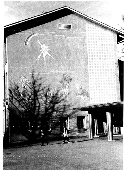
Schulhaus Daleu in Chur, Ostseite, mit Fassadenbild «Die Jahreszeiten» von Alois Carigiet, 1952, restauriert 1974 (vgl. Stadtarchiv F01.135a-e).

zung Carigiets. Anlass war ein Gespräch über ein Wandbild eines anderen Malers an der nahe gelegenen Erlöserkirche. Was ihn daran störte, war die detailierende, präzis-lineare Zeichnung von Gesicht und Körper der Figuren. So wirke das Ganze kalt