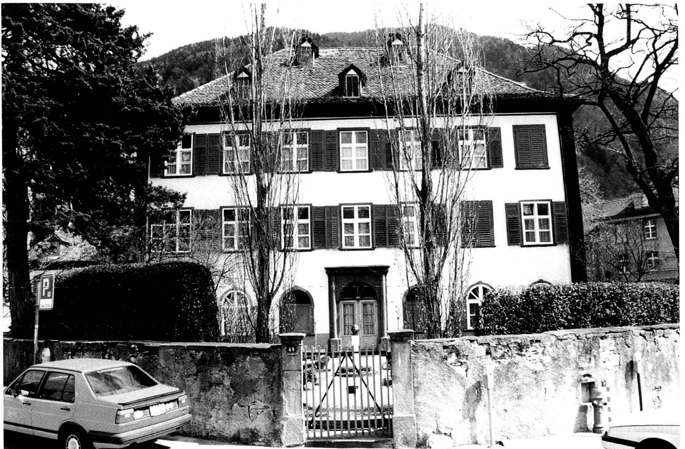
Die Westfassade mit dem Hauptportal und dem Vorgarten.

Trotzdem – und das ist das eigentlich Erstaunliche am Haus Salis auf dem Sand – begann Salis kurz nach seinem Umzug nach Chur um 1818 mit der Errichtung seines klassizistischen Repräsentations-