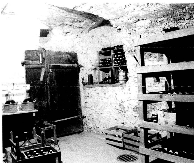
Der tonnengewölbte Keller der Bawierschen Weinschenke. Neben dem Keller stammt auch ein grosser Teil der Südfassade vom Vorgängerbau. (Foto M. B. 1996)

baut und bestand aus dem eigentlichen Gasthaus und einem Stall. Ausserdem wissen wir aus dem Kaufvertrag zwischen Salis und Laurer von einem Kegelplatz auf dem Grundstück. 15