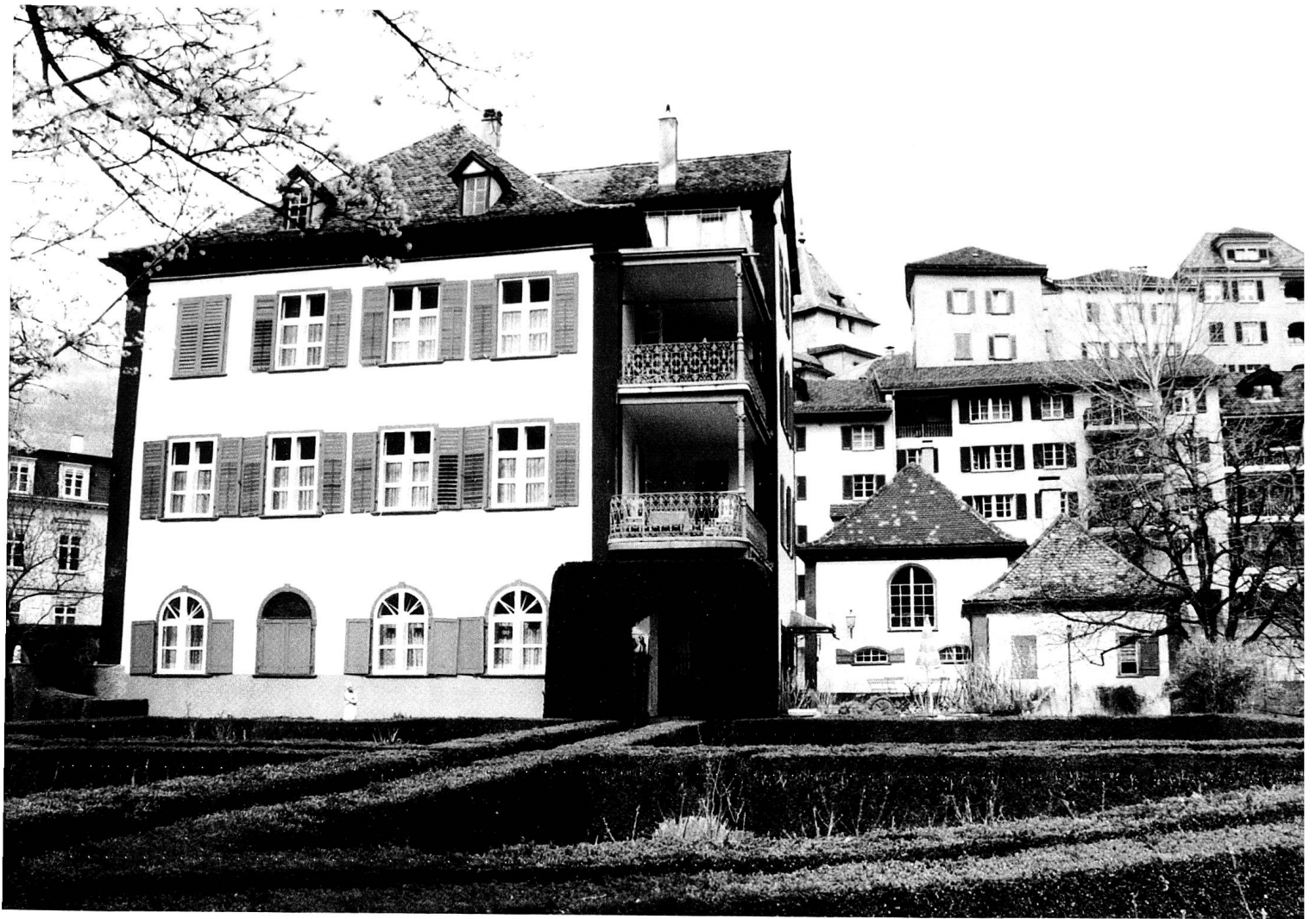
Südensicht des Hauses Salis auf dem Sand. Das Wohnhaus wird rechts vom Ökonomiegebäude und dem Wasch- und Backhaus flankiert. Im Vordergrund das Buchsparerre.