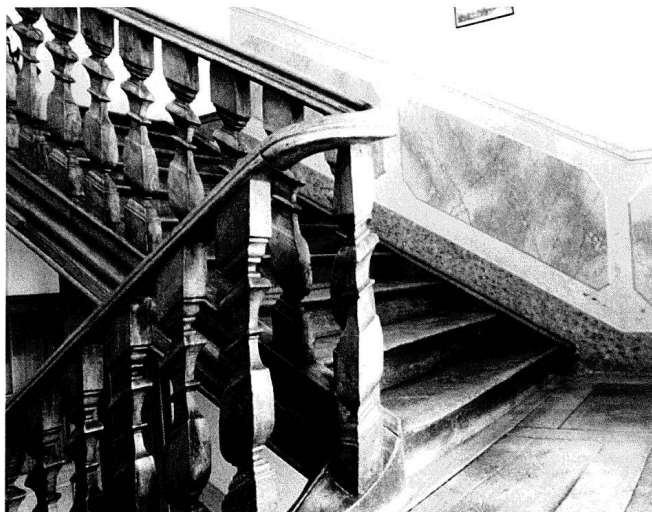
Das Treppenhaus mit barocker Balustrade und aufgemalten Marmorimitationen auf dem Absatz zwischen dem ersten und zweiten Stock.

Das Wohnhaus ist ein freistehender liegender Kubus mit sieben Fensterachsen an der westlich ausgerichteten Hauptfront und vier Fensterachsen auf den Schmalseiten. Der Ostfassade ist ein risalitartig vorstehendes Treppenhaus vorgebaut. Der dreigeschossige Bau wird durch ein hohes zwei-