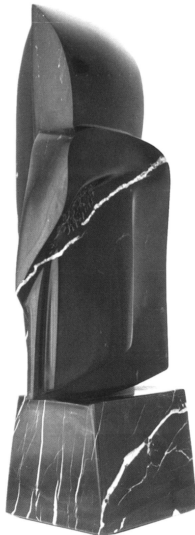
Der kleine Lichtensteiner, 1997, Lichtensteinerkalk poliert und bearbeitet, 47 x 23 x 12 cm.

So sehr auch das beschriebene Vorgehen Ralstons in Kostbar auf den ersten Blick demjenigen in den zitierten Arbeiten des 16. und 19. Jahrhunderts wie auch seinen eigenen früheren Arbeiten gleichen mag, haben wir es dennoch mit einem bedeutsamen Wandel im Schaffen Ralstons zu tun. Denn nicht mehr die Hand des Künstlers ist es, die die bewegten, schrundigen Oberflächen gestaltet hat, sondern er bedient sich einer zufällig entstandenen Bruchkante oder -fläche, deren Zustandekommen sich letztlich der inneren Struktur des Steins selbst verdankt. Das