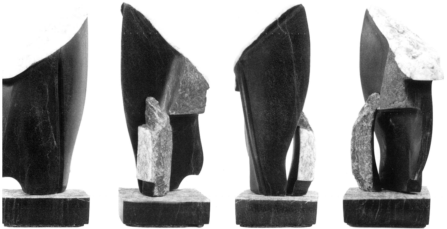
Kostbar, 2000, Scalära poliert mit Rohflächen, 23,5 x 10,5 x 10 cm.