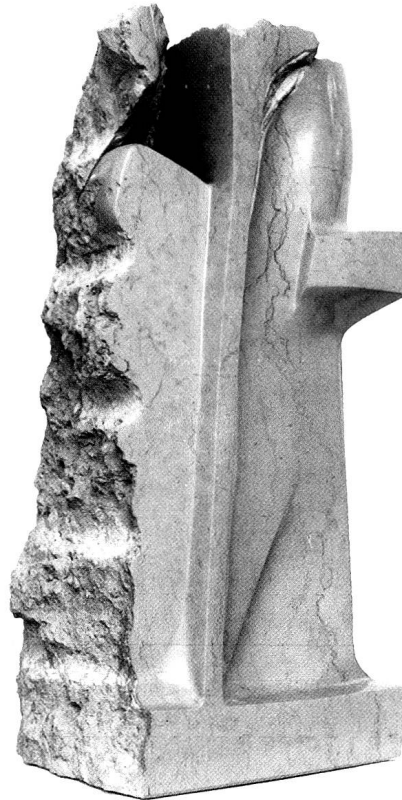
Verpuppen, 2000, Comblanchien poliert und teilweise bearbeitet und bruchroh, 69 x 25 x 33 cm.

Dem gleich einem weidenden Tier abtastenden Auge des Beschauers sind im Kunstwerk Wege eingerichtet [...] Das bildnerische Werk entstand aus der Bewe-