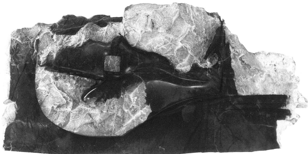
Das Meer, 2001, Chinagreen poliert und teilweise bruchroh, 42 x 88 x 11 cm.

In der Arbeit Aneinanderschmiegen 17 legt sich eine steinerne Hülle halbkreisförmig um einen hölzernen Kern, wobei beide Teile formal in vielfacher Hinsicht aufeinander Bezug nehmen; als Beispiel sei der diagonale Einschnitt auf halber Höhe der Schmalkante des hölzernen Kerns ge-