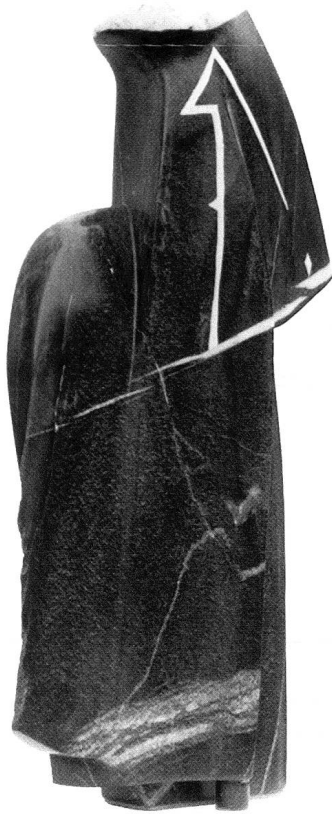
Ohne Titel, 1998, Scalära poliert mit Kunststoff, 59 x 53 x 14 cm. (Foto M. Dahli, 2002)