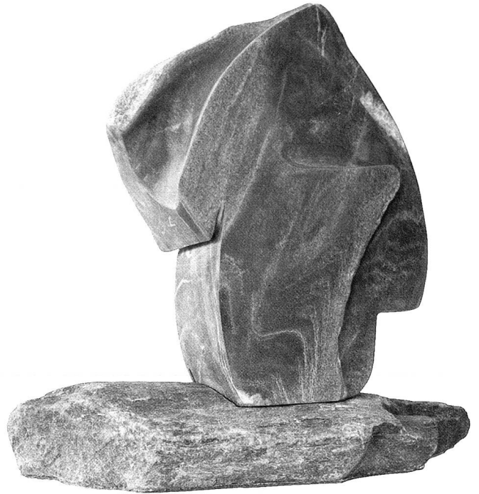
Der gleitende Gedanke, 2000, Scalära geschliffen und teilweise roh, 44 x 46 x 26 cm.

ineinander verschlingen. Gerade durch diese gegensätzlich gestalteten Übergänge entsteht der Eindruck eines ständigen Werdens und Vergehens. Haben sich die glatt polierten Flächen so eben aus den rauhen erhoben oder gehen sie schon wieder in den anderen «Aggregatzustand» über? Das Bild einer Genesis drängt sich geradezu auf. Nicht zufällig finden sich im Schaffen Ralstons denn auch zahlreiche Arbeiten, die mit