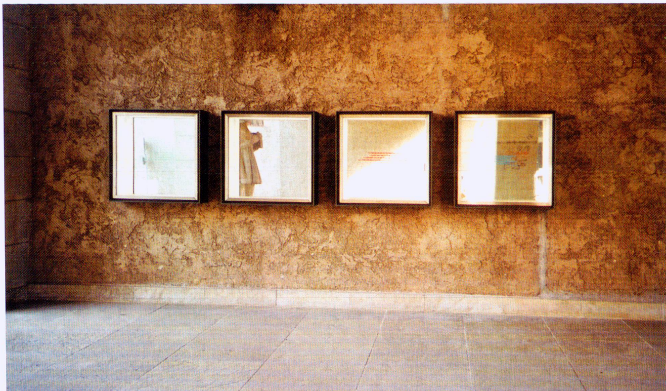
Grenzlicht; 4 Vitrinen; Spiegel, 4 farbige Streifen; Museum zu Allerheiligen, Schaffhausen 2003.