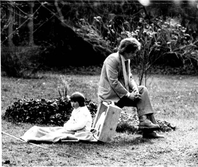
ho desiderato sempre avere un cavallo; Performance, Museum zu Allerheiligen, Schaffhausen 1990.

men und Türen öffnen kann, so das Unbekanntes erfahrbar wird. Da erweist er sich als unermüdlicher Anreisser, der Neugierde wecken und Mut machen kann. Greifen wir drei Beispiele heraus.