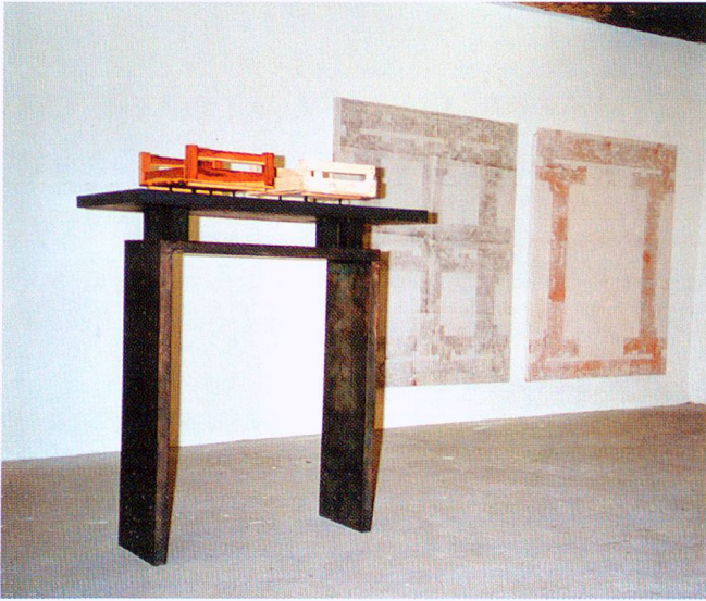
Aus der Sammlung wichtiger Dinge; Objekt und Bild; Fichte, Zwetschge, Spanplatte, Lackfarbe, Leim, Asche, Farbpigment; Galerie Tircal Domat/Ems 2000.