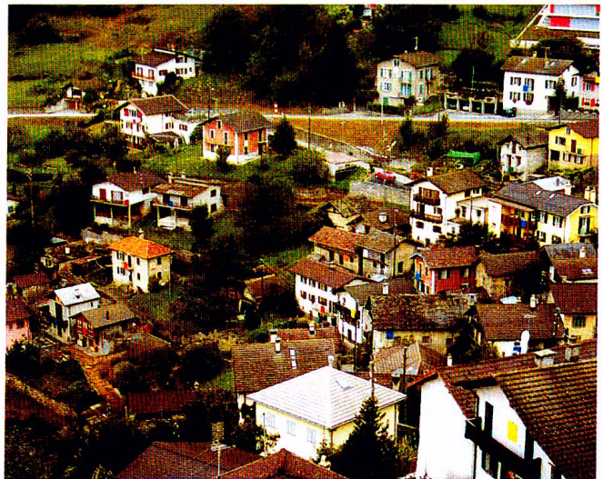
Rumor in Santa Maria im Calanccatal, Sommer 2002.

Auch wenn diese Arbeit Peter Trachsels nur bedingt mit den gängigen Kriterien beurteilt werden kann, die üblicherweise an Projekte zur «Kunst am Bau» angewendet werden, stellt sich doch die Frage, was neben den inhaltlichen an gestalterischen Impulsen zurückbleibt. Da stellt man mit zunehmendem Erstaunen fest, wie die in die Wände eingelassenen Schrift- und Farbzeichen die Stockwerke auf zurückhaltende, aber sehr bestimmte Art miteinander verbinden. Gerade die unübliche Platzierung der Tafeln, die neugierig macht, trägt sehr zu dieser Wirkung bei. Und wenn dann jede halbe Stunde ein Wassertropfen durch das ganze Gebäude her- und hinunterfällt, wird diese Verbindung oder Verknüpfung der Ebenen noch eindringlich verstärkt.