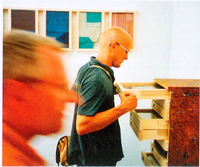
Schürzen; Holz, Textil, Glas; Galerie Apropos, Luzern 2002.

UND UNTERSUCHUNG; ZEUG; VERSEHEN MIT ETWAS; AUSSTAFFIEREN; AUSSTOPFEN; VERSTOPFEN; STOFFWECHSEL; KLEIDUNGSSTÜCK; NOMADE; MIGRANT». Für den Raum des «vebikus» plante er neun Stoffbehälter (Holz, Glas, Metall, Textil). Es waren Kästen mit Schubladen, in denen sich Kleidungsstücke teils aus der Sammlung der HASENA, teils aus dem Fundus von Freunden und Bekannten befanden. Wichtig war, dass es sich um ein liebgewordenes Kleidungsstück handeln musste. Die Schubladen wurden beschriftet und (falls die Erlaubnis vorlag) mit dem Namen der vormaligen Besitzerin bzw. des vormaligen Besitzers versehen. Es fand ein Stoffwechsel, im ~weiteren Sinne ein Tausch statt. Die geschlossenen Kästen wirkten in ihrer Säulenhaftigkeit eindrücklich, aber auch unnahbar, hermetisch. Sobald sich der Besucher aktiv einschaltete, eine Schublade öffnete, sich also «wundrig» zeigte («darf man das?»), tat sich eine ganze (kleine) Welt auf. Es passierte das, was der Künstler auszulösen beabsichtigte.