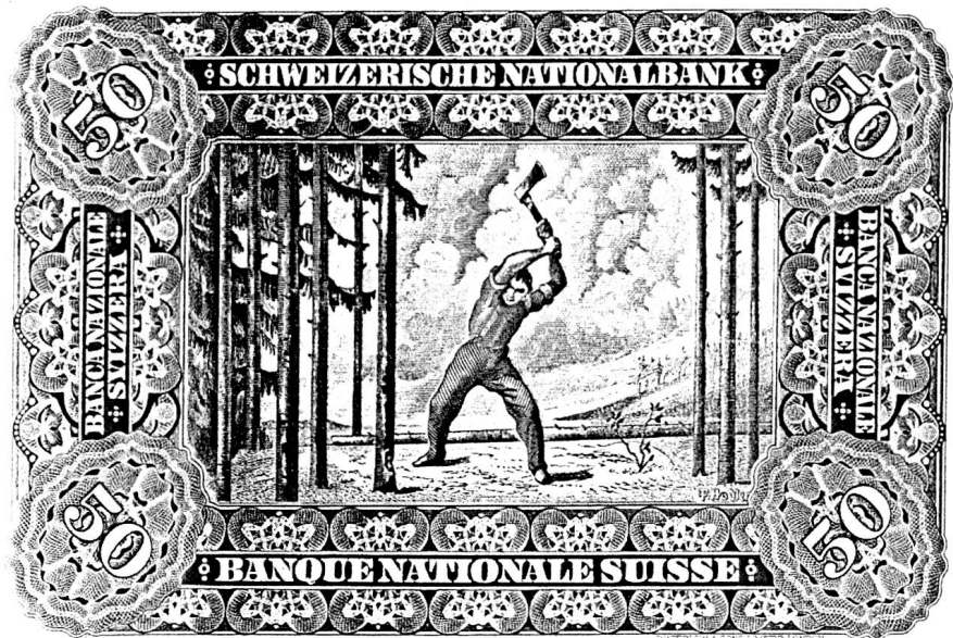
Studie zum Holzfäller von Ferdinand Hodler für die 50-Franken-Note der Schweizerischen Nationalbank, im Umlauf 1911–1958. (Quelle: Michel de Riva: Die schweizerische Banknote 1907–1997. Lausanne 1997)

In der Literatur hingegen treten Bäume immer noch oder immer wieder zutage und drängen Lyriker und Erzähler zur