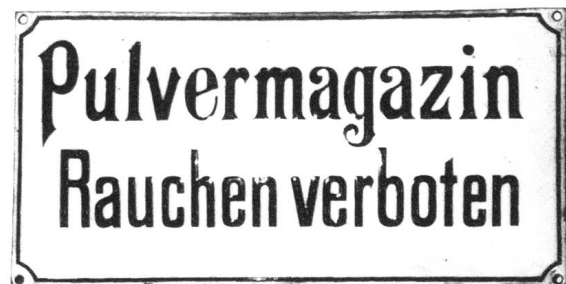
Warntafel am Eingang in ein Pulvermagazin.

Der Churer Architekt Thomas Domenig war es, welcher erkannte, dass aus diesem Gelände ein für Chur einmaliger Tier- und Freizeitpark zu