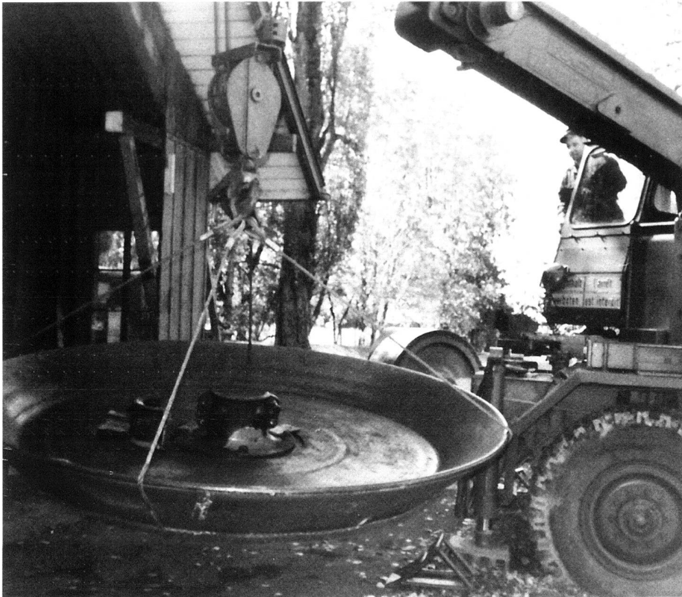
Ausbau des Läufers Nr. 3 zum Abtransport nach Aubonne VD im Jahr 1976.

Sprengwirkung bis heute in Gebrauch. Auch findet es für Feuerwerkskörper und für das wieder entdeckte Vorderlader- und Böllerschiesen vermehrt Verwendung. (Campiotti, S. 49)