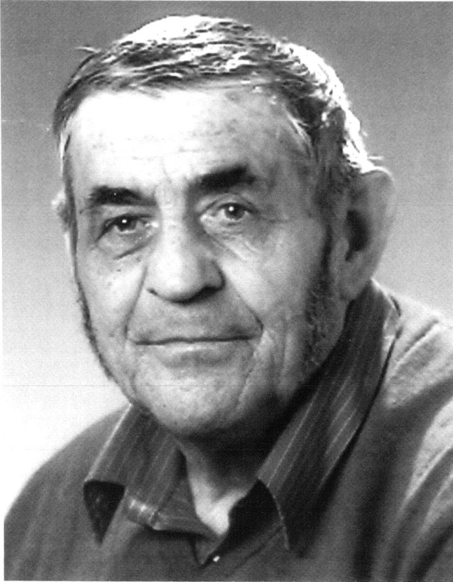
Hans Kocher (1926–2003).

schaffen wäre. Im Jahre 2000 wurde der Kaufvertrag mit dem Bund unterzeichnet und schon im August 2003 konnte der Park eröffnet werden. Bereits haben sehr viele Leute die Anlage besucht. Damit wurde für Chur eine einmalige Chance wahrgenommen, aus bereits Vorhandenem etwas Sinnvolles zu gestalten, und man darf mit Recht Herrn Domenig und seinen Mitarbeitern für die gelungene Umsetzung dieser Idee gratulieren.