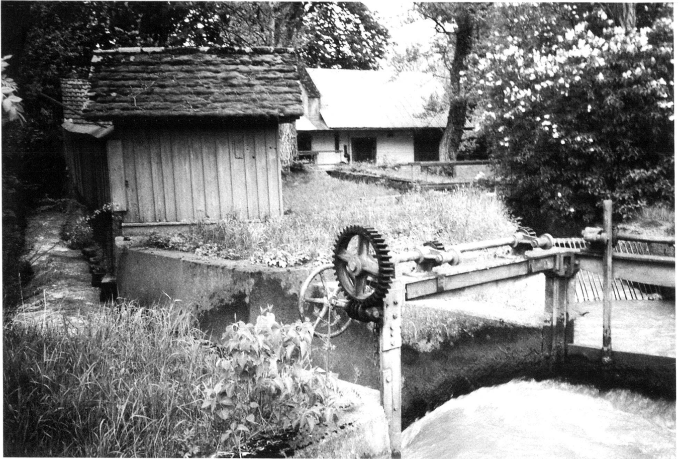
Hauptfalle bei der Abzweigung des Werkkanals.

zelerlass stiess Marin in arge Bedrängnis. Er bedeutete für den Jungunternehmer, entweder für den neuen Bundesstaat in einem schlechten Akkordverhältnis Pulver herzustellen, oder die ganze, mit viel Mühe aufgebaute Anlage abzutreten, was dann 1858 nach langwierigen Verhandlungen auch erfolgte. (Brunisholz, S. 251)