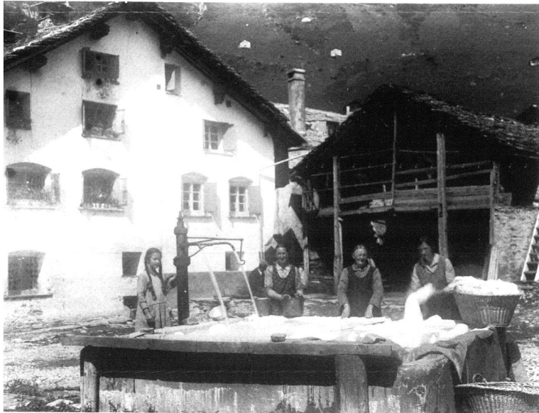
Hinterrhein Dorfplatz um 1930.