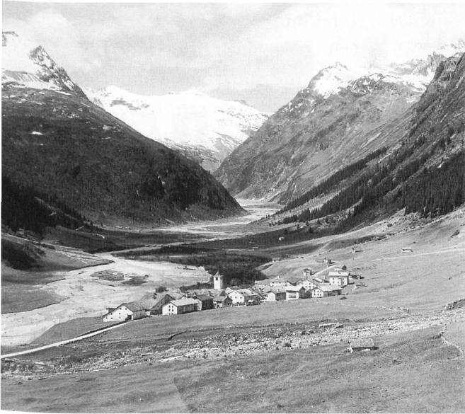
Hinterrhein um 1920.