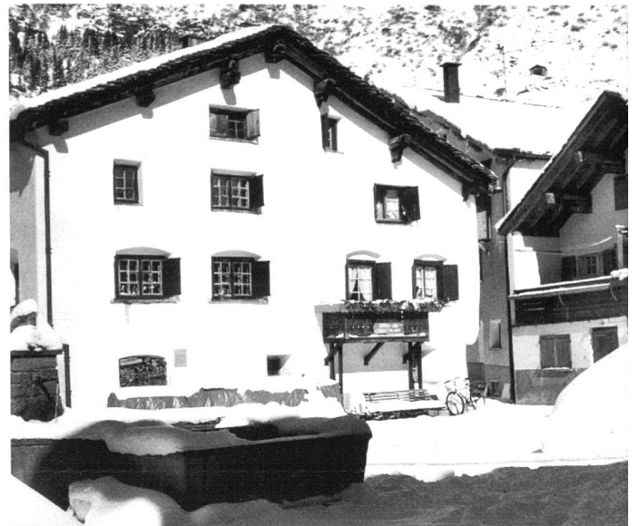
Hinterrhein Dorfplatz, April 2004.