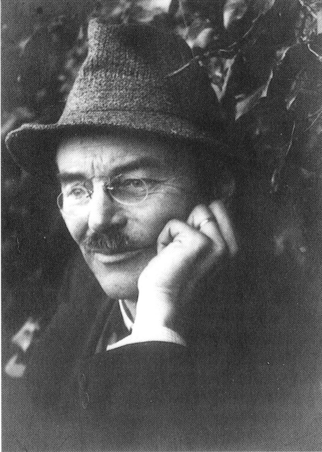
Professor Josias Braun-Blanquet aus Chur um 1935.

Meter hoch gewesen, angezeigt in eindrücklicher Weise auf mittlerer Brusthöhe. Als weitere Personen hinzu traten, waren die Wellen bereits auf über Kopfhöhe. Als sich der Kreis der Zuhörer nochmals erweiterte, hatten die Wogen schon gut die Höhe der Strandhäuser erreicht. Um einer bevorstehenden Sturmflut zu entgehen, brachten wir uns in den «Flots Bleus» bei einem Glas Pastis in Sicherheit.