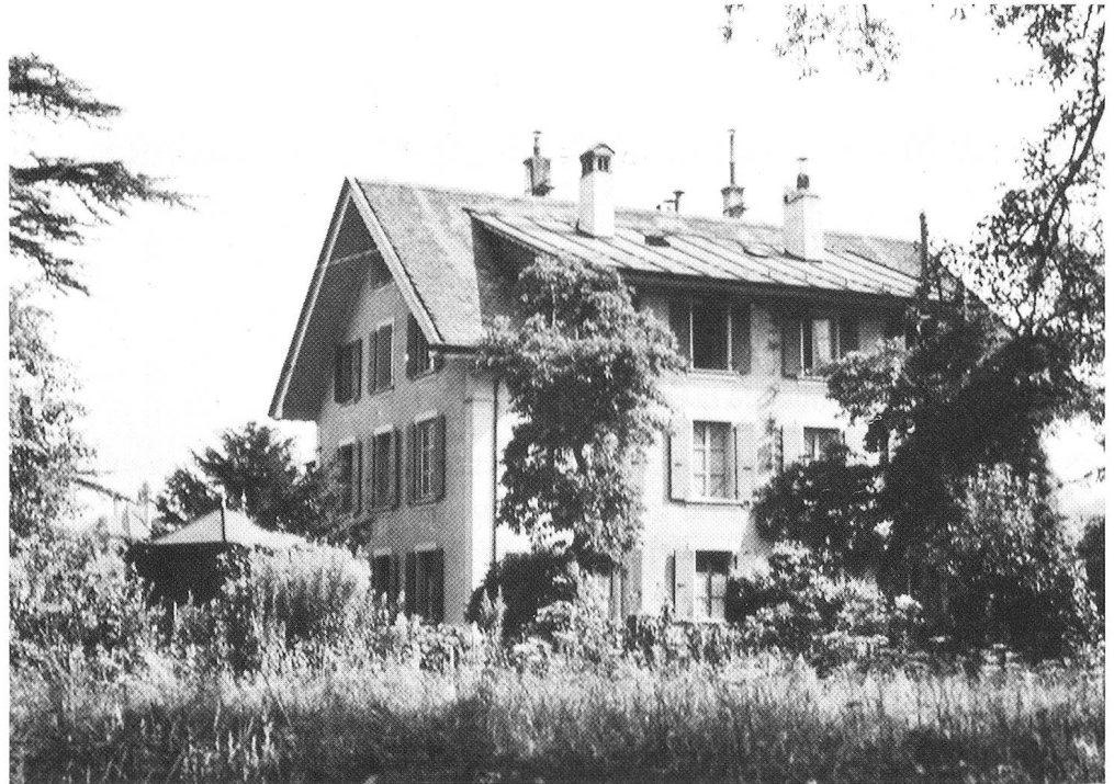
«Bon Air», altes Waadtländer Haus, wo der Verfasser in Lausanne wohnte, heute längst einer Strassenkreuzung gewichen.

bünden findet sich ein handschriftliches Dokument aus dem 17. Jahrhundert, das zeigt, dass diese Universität selbst in Fragen der Hexerei als kompetent galt: «Antwort der Universität Montpellier auf etliche vermeinte Zauberey und Besessenheit betreffende Fragen.»