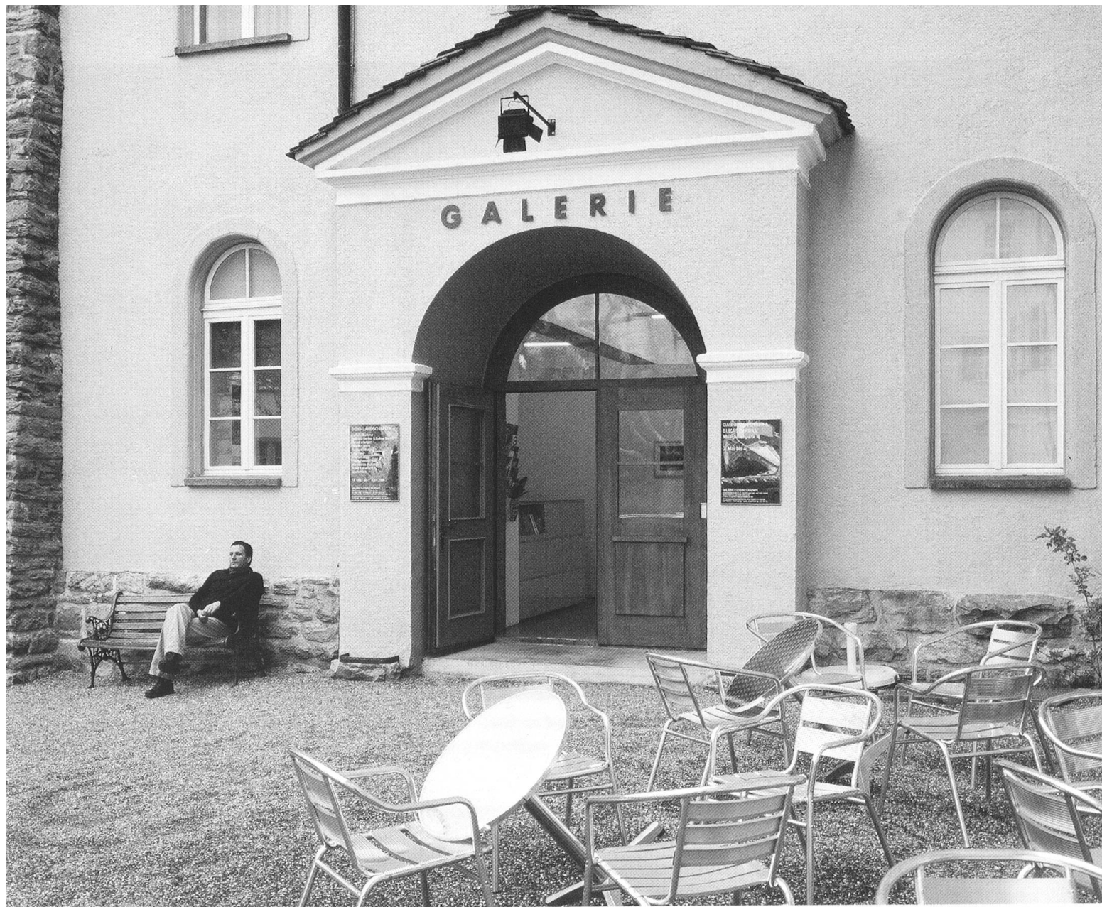
Galerie Luciano Fasciati, Chur.