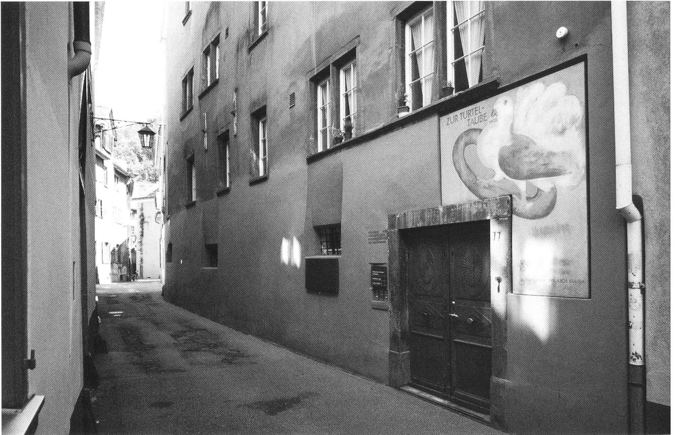
Galerie «Studio 10» Rabengasse 10, Chur. (Foto Stephan Schenk, 2005)

GK: Wen schätzen Sie von den Bündner Künstlern? Andere?