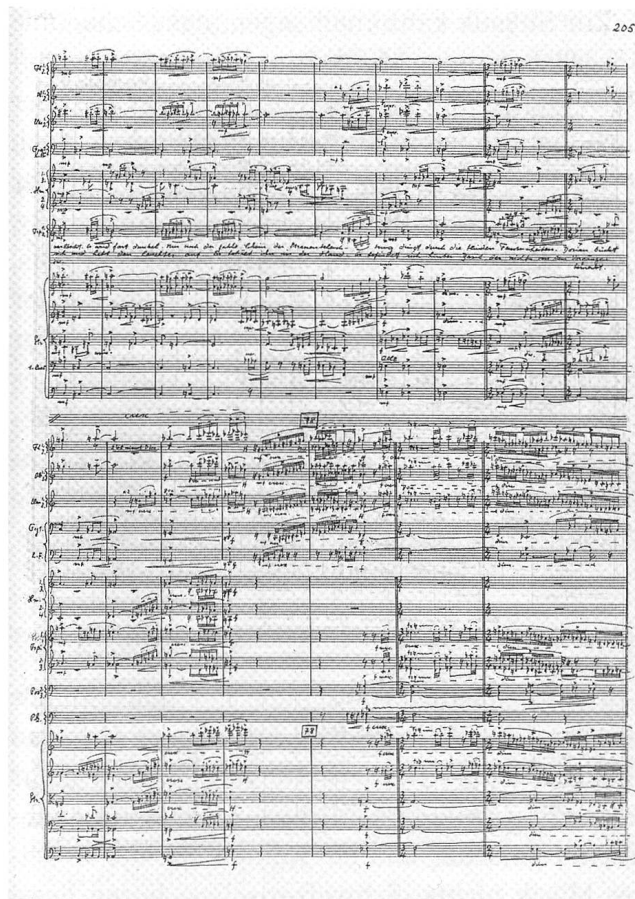
Notenseite aus der autographen Partitur der Oper Dorian Gray op. 32. Der Ausschnitt stammt aus dem 5. Bild (II. Teil). An dieser Stelle tötet der Hauptdarsteller Dorian den Maler Basil Hallward.

An der Gattung der Oper versuchte sich Schaeuble schon sehr früh. Sein zweites Werk war die Oper Dagmar op. 2. Diese erklärte der Komponist aus Qualitätsgründen später für ungültig. Das zweite grosse Opernprojekt, an das sich Schaeuble erst 1947 wagte, war das wichtigste Stück für Schaeuble überhaupt: Die Oper Dorian Gray op. 32. Dieses Opus erwähnt Schaeuble