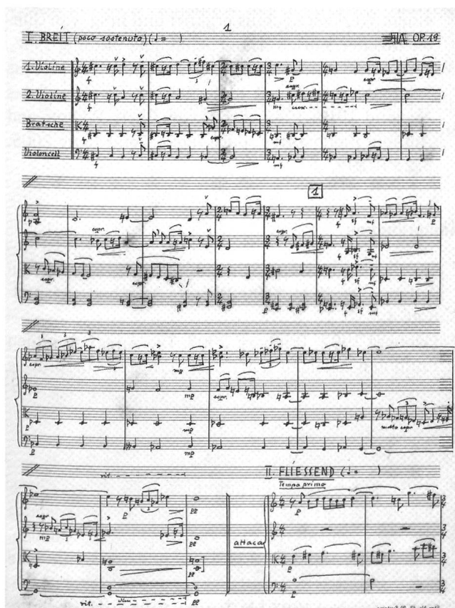
1. Notenseite aus der autographen Partitur der Musik für Streichquartett op. 19, Fassung 1935.

Dass das Oeuvre Schaeubles eher klein geraten ist, liegt daran, dass der Komponist nach 1968 praktisch keine weitere Musik komponiert hat. Mit zunehmenden Alter hat Schaeuble seine früheren Werke ständig und wiederholt revidiert, sodass von fast jedem Werk mehrere Fassungen überliefert sind. Schaeuble bekannte selbst, dass ihm nach 1968 neue Ideen zur Komposition fehlten. Dieser Umstand belastete ihn sehr.