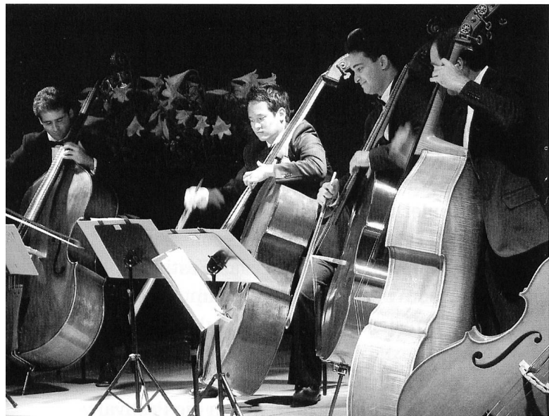
Kontrabass-Sextett Bassiona Amorosa am Schlusskonzert 2008.

Zu Haefligers Nachfolger wurde der 51jährige Deutsche Dirk Nabering gewählt, ein scheinbar idealer Kandidat: Er war Dramaturg beim Lockenhaus-Festival, leitete verschiedene Konzertreihen in Freiburg im Breisgau und in Frankfurt. Zudem führte er bei den Berliner Musikfestwochen den Musikbereich, zu welcher auch eine Konzertplattform für junge Künstler gehört, und arbeitete darüber hinaus mit verschiedenen Jugendorchestern.