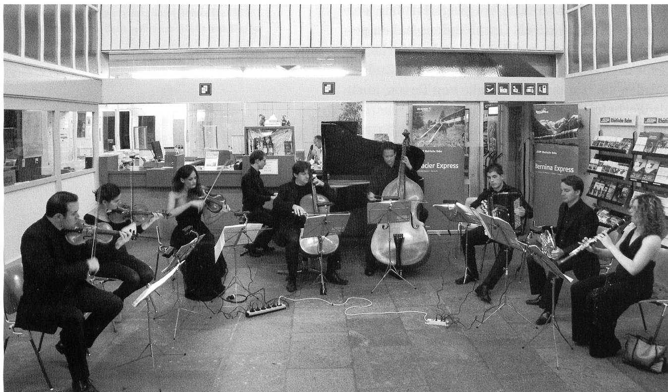
Nocturne-Konzert im Bahnhof Davos Platz anlässlich des «Davos Festival» 2008.

Musiker zusammenzuwürfeln, die sich bis dahin nicht kennen, und sie die grossen Werke der klassischen Kammermusik spielen zu lassen, ist heute als Festivalkonzept durchaus etabliert. Damals aber war das eine ziemlich exotische Idee, umso mehr, als die Elite der jungen Musikergenerationen an ihren Hochschulen selbstverständlich für die Solistenkarriere gestählt worden war