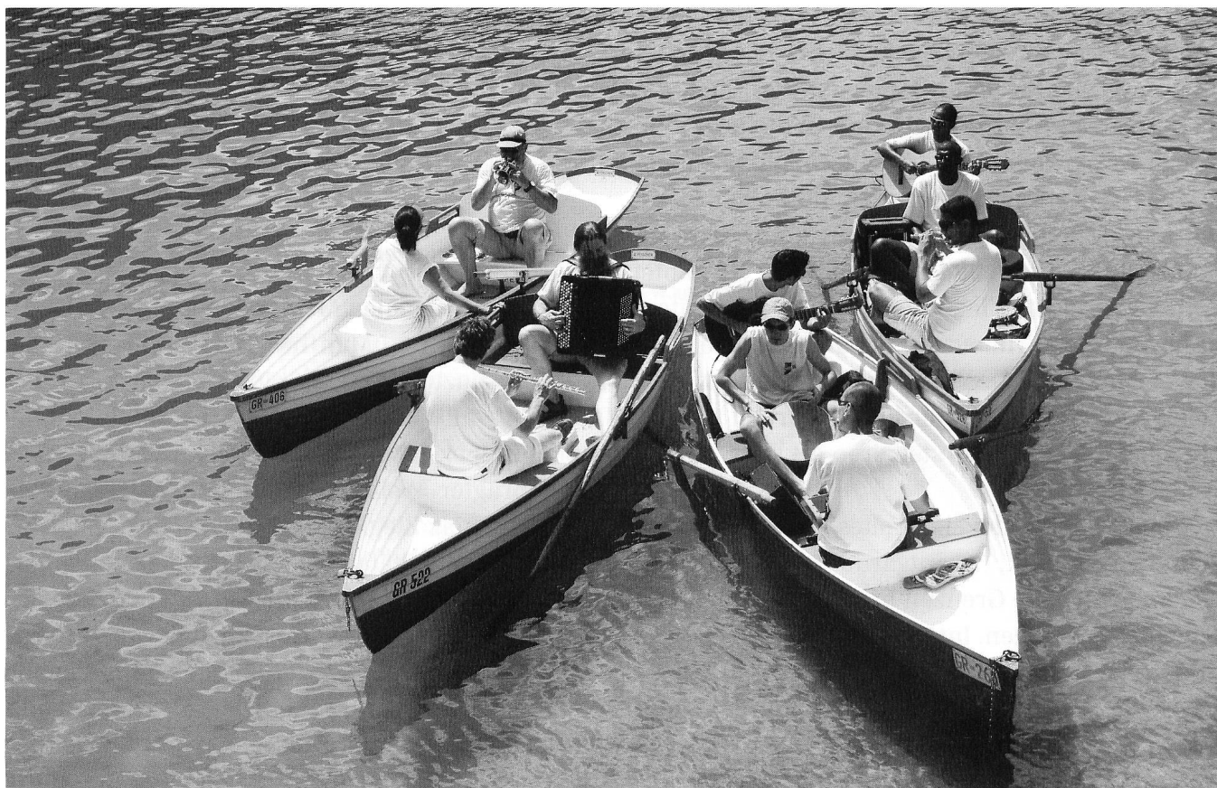
Konzerteinlage am Caumasee im Rahmen von «FlimsKlang», Juli 2006.

Nun hat aber «Flims Klang» der Gemeinde ohne Zweifel neben Ideellem auch zählbare Werte, etwa in Form von generierten Übernachtungen, zurückgegeben. Hätte das nicht auch skeptische Geister unter den politisch Verantwortlichen überzeugen müssen? «Ja, aber man kann den Wert eines Festivals nicht allein in warmen Betten beziffern. Ich glaube nicht, dass man an