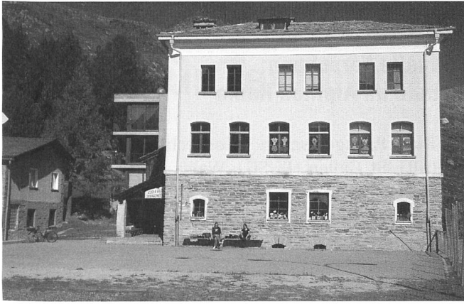
Schulhaus Maloja, wo zweisprachig (it/dt) unterrichtet wird.

führung einer zweiten Fremdsprache im Primarschulbereich und von Ethik als neuem zusätzlichem Fach, ist der Anspruch, eine Lehrperson in sechs Semestern in allen Fächern auszubilden, nicht mehr erfüllbar. Deshalb wird in Zukunft der Weiterbildung eine noch grössere Bedeutung zukommen, als sie sie jetzt schon hat. Die PHGR führt eine Abteilung Weiterbildung, die obligatorische Kurse im Auftrag des Kantons durchführt und freiwillige Kurse anbietet. Immer häufiger finden solche Kurse als schulinterne Weiterbildung in den einzelnen Schulhäusern statt.