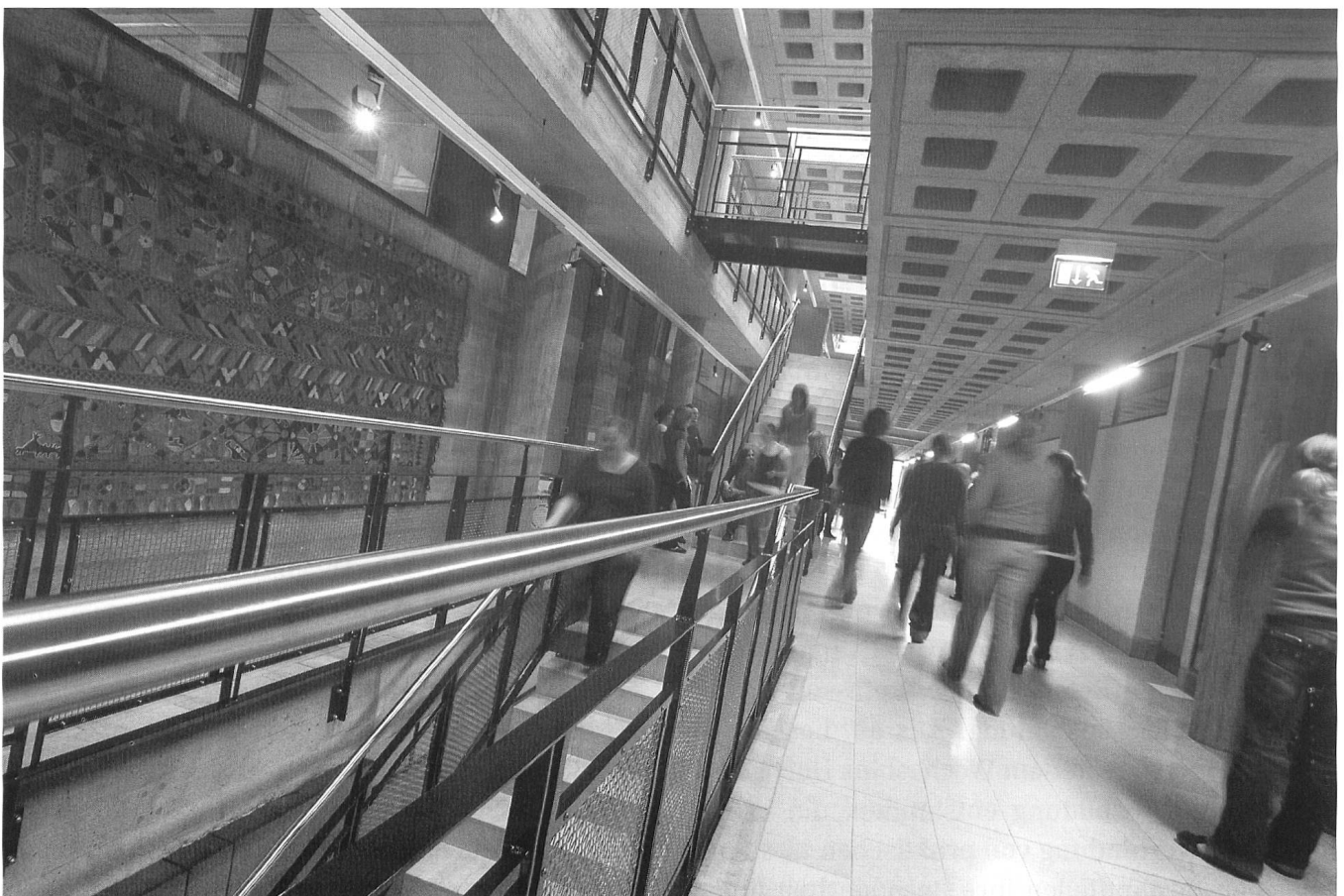
Studierende des Studienjahres 2002 in der PHGR.

Der Spagat, einerseits eine Berufsschule und andererseits eine Hochschule zu sein, fordert täglich heraus. Ziel der Ausbildung muss sein, Lehrpersonen auszubilden, die sich im Kindergarten und der Primarschule bewähren. Nicht nur das: Die mit Freude in ihrem Beruf stehen und gerne weitergeben, was sie gelernt haben. Mit der Ein-