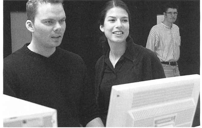
Im Teamwork zukunftsorientierte Lösungen finden.

Chur die erste Fachhochschule in der Schweiz, die einzelne Studiengänge nach den 2007 verabschiedeten Vorgaben und Richtlinien des Bundes durch das Organ für Akkreditierung und Qualitätssicherung der Schweizerischen Hochschulen OAQ erfolgreich akkreditieren liess. Dazu gehört aber auch, dass im Jahr 2010 das Institut für Tourismus- und Freizeitforschung ITF nach ISO 9001:2008 als Pilot zertifiziert wurde.