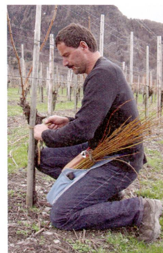
Jede einzelne Rebe wird sorgfältig mit Weidenruten gebunden. Für diese traditionelle Arbeit konzipierte Manfred Meier eine spezielle Tragschürze, die auch Rebschere und Baumsäge aufnimmt.