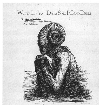
Drum sing i grad drum : Plattenhülle von 1981 mit einer Illustration von Thomas Zindel.