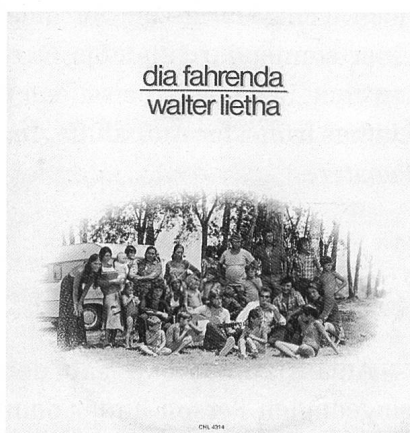
Plattenhülle Dia Fahrenda von 1977. Die Fotografie von Toni Vescoli entstand «irgendwo in italia».

Eine weitere Erscheinungsform des schweifenden Anti-Bürgers findet Lietha im fahrenden Volk. Si läben freier als alli