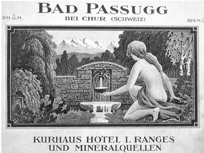
Kurhaus Bad Passugg, Prospekt von 1920.