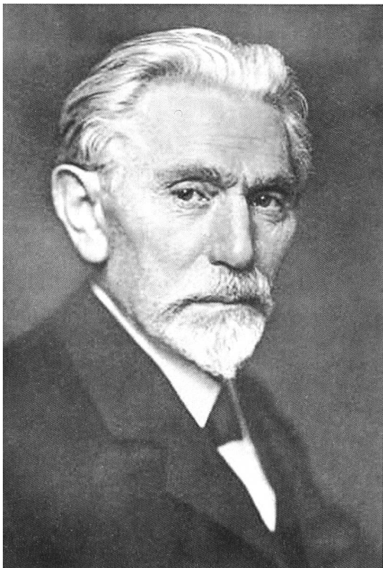
August Bebel um 1910, Ansichtskarte.