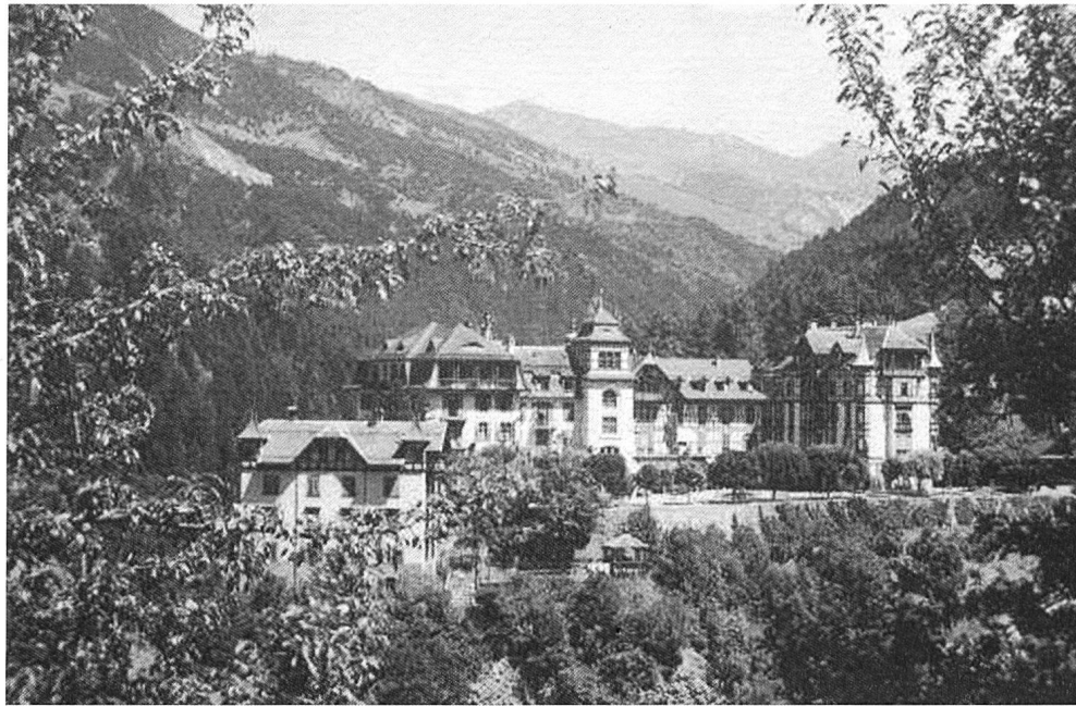
Kurhaus Bad Passugg.

Wahn den Ersten Weltkrieg los- trat, machte er zwar Weltge- schichte, konnte aber ihren fa- talen Lauf nicht ändern, obwohl er bis in seine letzten Lebens- tage in Bad Passugg oben mit ganzer Kraft für die Erhaltung des Weltfriedens kämpfte. Seine Briefe aus Passugg legen ein be- redtes Zeugnis ab von einem Menschen, der im eigentlichen Sinne bis zum ultimativen Herz- schlag versuchte, das Schlimms- te zu verhindern. Dass dem Sol- datensohn, der 1840 in extrem ärmlichen Verhältnissen gebo- ren wurde, einst diese weltge- schichtliche Rolle zukommen würde, hätte ihm wohl niemand an seiner Wiege prophezeit. Die- se bestand nämlich aus nichts anderem als einem Haufen aus feuchtem Stroh und befand sich in einer Kasematte der Kaserne von Köln-Deutz, wo sein Vater und wenig später sein Stiefvater förmlich verhungerten. Bebel, später gelernter Drechsler ge- worden, schloss sich 1860 der Arbeiterbewegung an und wur- de einer ihrer begabtesten Red- ner. Schon 1867 wurde er als Mitbegründer der Sozialdemo- kratischen Deutschen Arbeiter- partei (SPD) in den Deutschen Bundestag gewählt. Wegen der Verfolgung durch die Bismarck' schen Sozialistengesetze psy- chisch und physisch ge- schwächt, weilte er im Alter