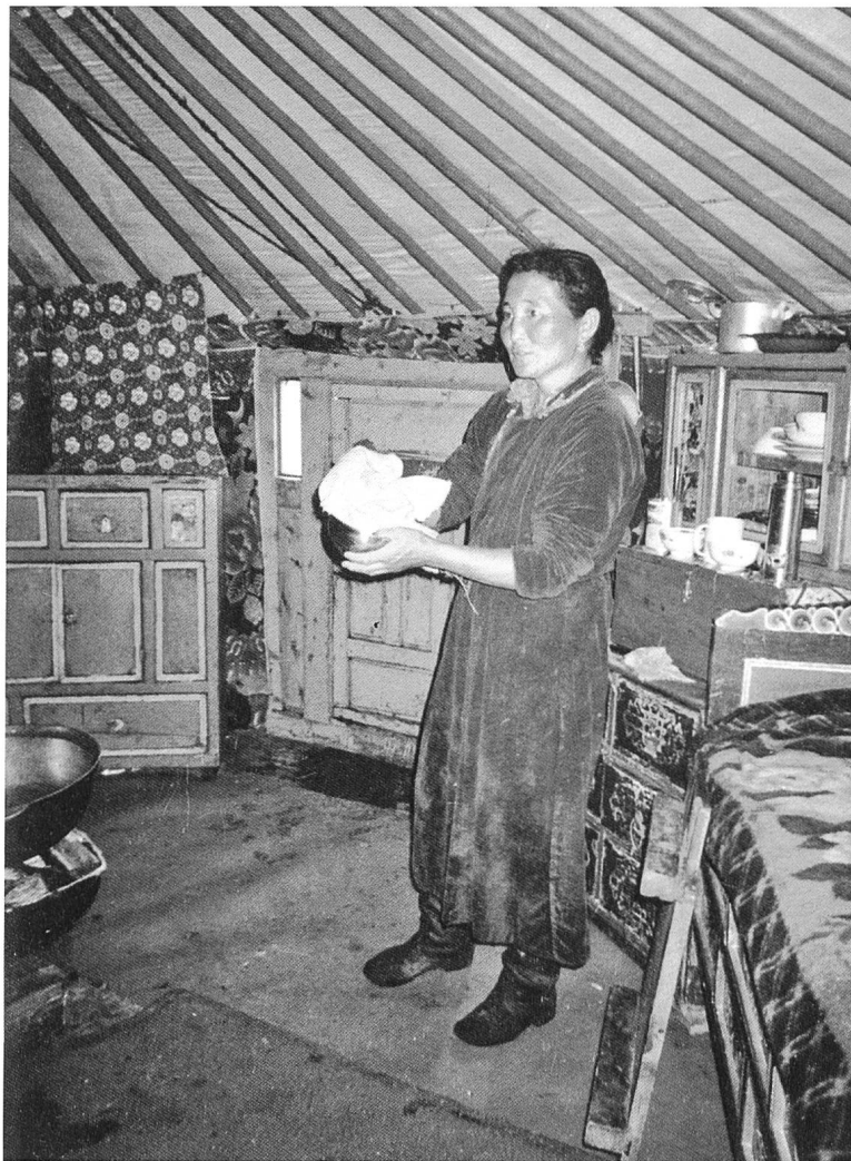
Mongolische Nomadin in ihrer Jurte im Jahr 2003.

es genug, aber die Anlage war recht verlottert. Für uns hatte man aber viele Tische und Bänke frisch gestrichen, so wiesen bald alle Farbflecken auf den Hosenböden auf. Die ganze Woche arbeiteten wir im Freien, es wurde viel auf Englisch gesungen, Geschichten erzählt, gespielt. Auf viel Anklang stiess ein Postenlauf mit Englischaufgaben in der Umgebung des Lagers. Die mongolischen Begleitpersonen fanden auch Gefallen daran und wünschten, dass sie den Lauf im Anschluss selbst machen durften, in Begleitung der grösseren Schüler, weil sie in der Regel selber nicht englisch sprachen. – Eine Nacht im Lager werde ich nicht mehr vergessen: Ich erwachte, weil es im Lehrerhaus sehr laut war. In einem Nebenzimmer sassen ein paar mongolische Begleiter und ein Lehrer, katzkanonenvoll! Ich wollte sie ins Freie schi-