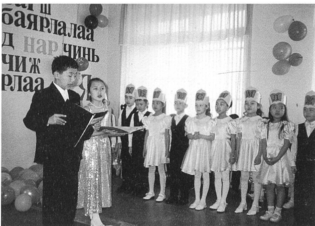
ABC-Fest mit mongolischen Kindern der 1. Klasse in Darkhan im Jahr 2003