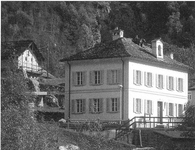
Casa Comunale.