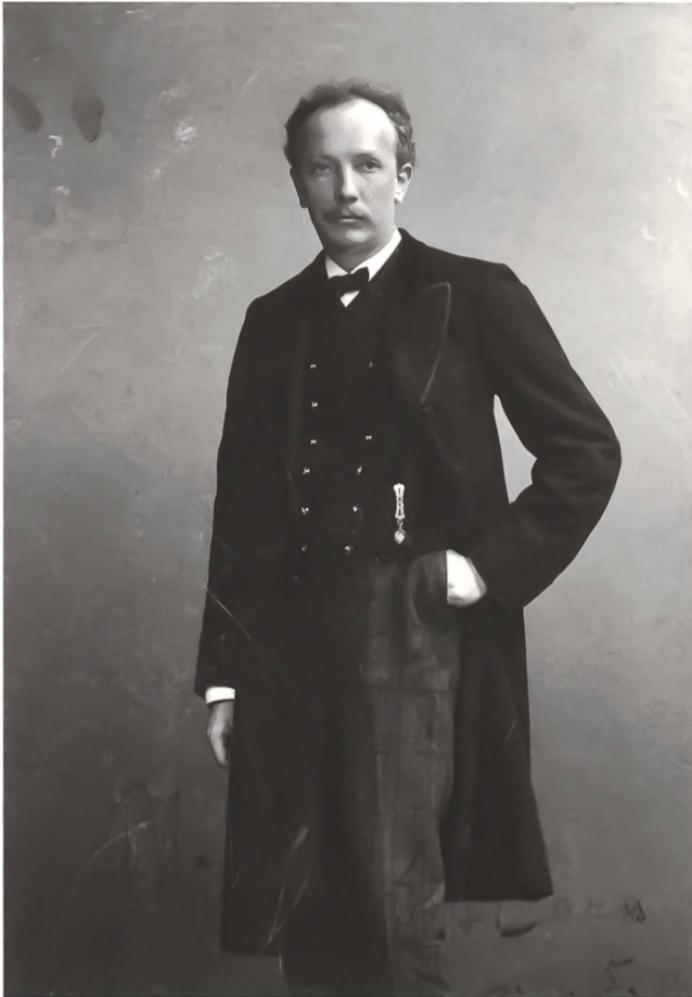
Richard Strauss, 6. März 1915.