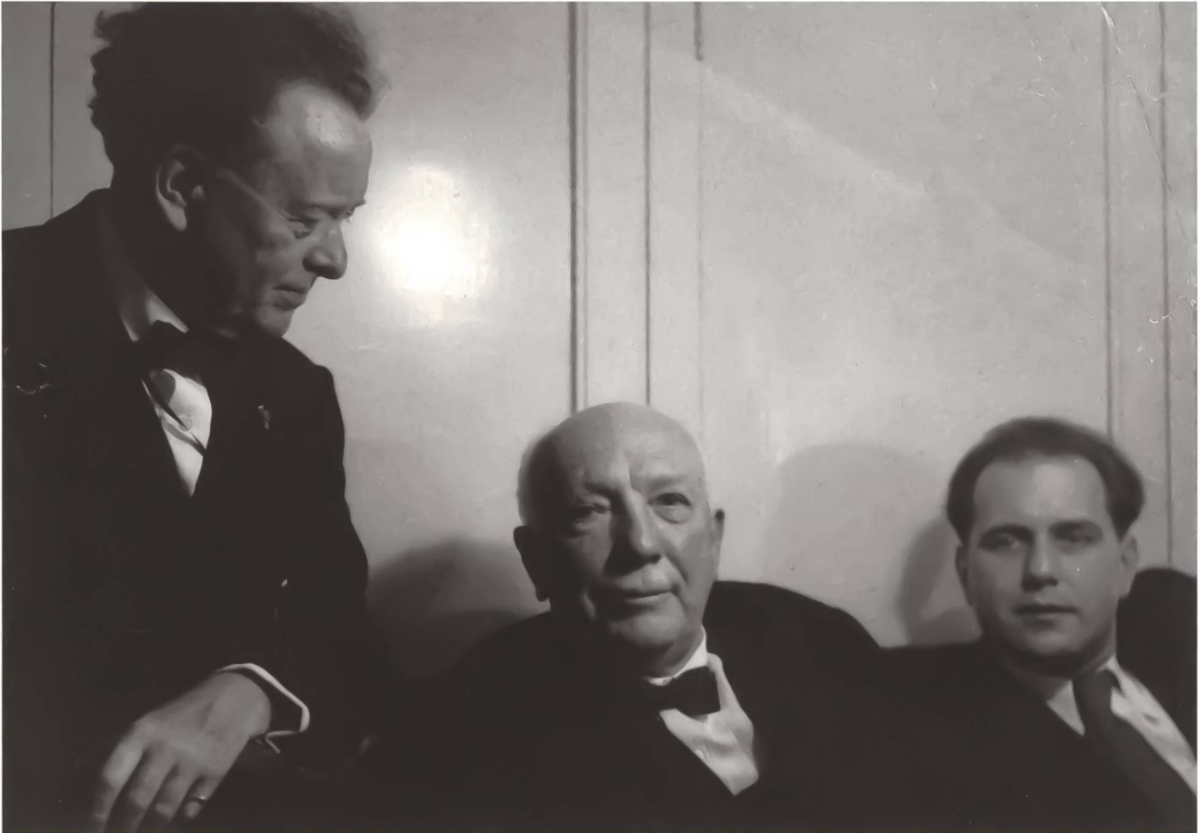
Willem Mengelberg, Richard Strauss und Hans Swarowsky (v.l.) in der Pause der Generalprobe zu Arabella in Amsterdam, November 1934.

Das letzte Besuch von Strauss am Amsterdamer Concertgebouw-Orchester fiel ins Jahr 1934. Es stand im Zusammenhang mit Festkonzerten und Aufführungen anlässlich seines 70-jährigen Geburtstags. Bei dieser Gelegenheit wurde Strauss Gross-Offizier von Oranien Nassau, eine ausserordentliche Ehre.