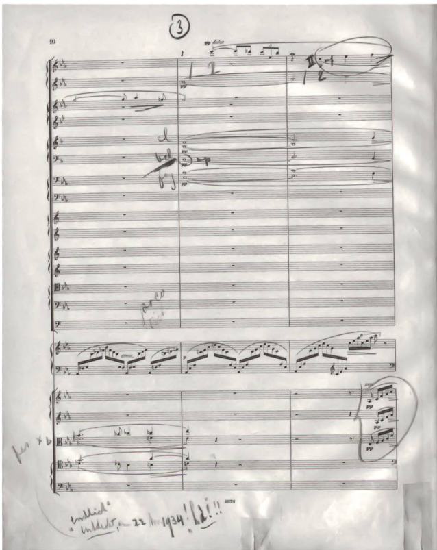
Korrektur in Tod und Verklärung in Mengelbergs Dirigierpartitur.

«Lieber Freund! Für heute will ich nur danken: Für Alles, was Sie in dreissig Jahren unermüdlicher Arbeit für mich u. mein Werk geleistet haben, für das wohl-gelungene Straussfest, für Ihr herrliches Orchester, das Don Quixote (mit einer viertelstündigen-) u. Alpensinfonie (ohne jegliche Proben) phänomenal u. seines Meisters würdig gespielt hat.»