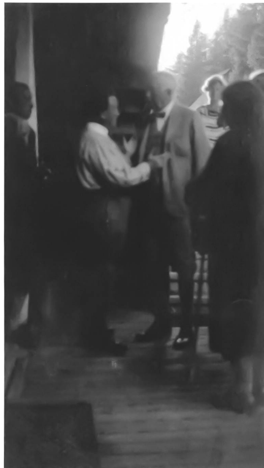
Besuch von Richard und Pauline Strauss in der Chasa Mengelberg, Zuort (Unterengadin), 4. September 1928.

Am 18. August 1916 schickte Strauss an Mengelberg ein Telegramm, in dem er ihn darauf hinwies, dass neben seinem Haus in Garmisch eine Villa zum Verkauf stand. Die Reaktion Mengelbergs fehlt, aber er hatte einige Jahre zuvor in Graubünden sein Chalet, die Chasa Mengelberg, bauen lassen. Das Haus, worauf Strauss hinwies, ist aber ganz im Stil der Chasa gebaut. Der Vorschlag von Strauss steht bildhaft für die sich seit 1898 entwickelnde Beziehung, denn es entstand nach und nach zwischen Strauss und Mengelberg eine herzliche, lange währende Freundschaft. Die Reise von Richard Strauss ins abgelegene Unterengadiner Zuort zu Mengelberg ist ein gutes Bei-