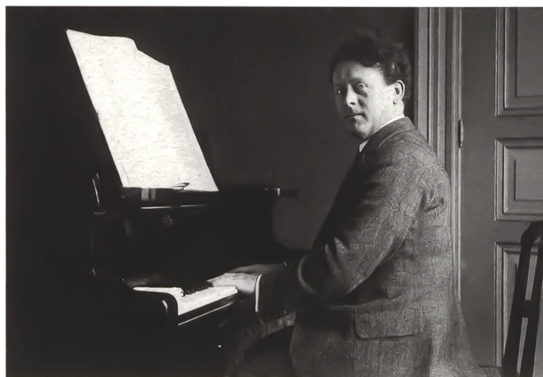
Willem Mengelberg am Klavier, 1910.

«Ich freue mich riesig über meine Gläser und églomisé und bin Ihnen noch sehr dankbar, dass Sie mir diese Wissenschaft erläutert und mir den Geschmack dafür beigebracht haben. Hoffentlich kommen Sie recht bald zu uns nach Garmisch, um meine Schätze zu begutachten.»