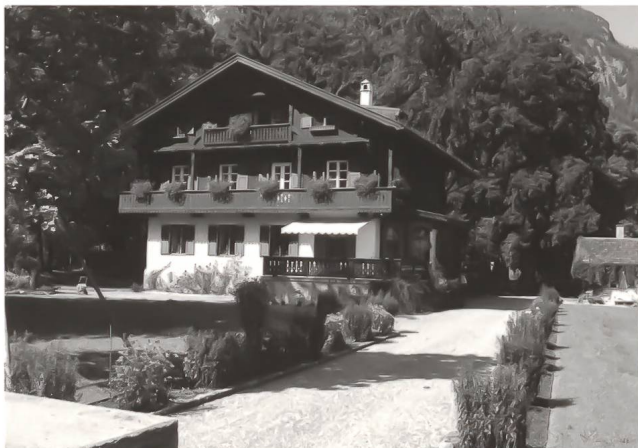
Die Villa neben dem Haus von Strauss in Garmisch, auf die Strauss hinwies.