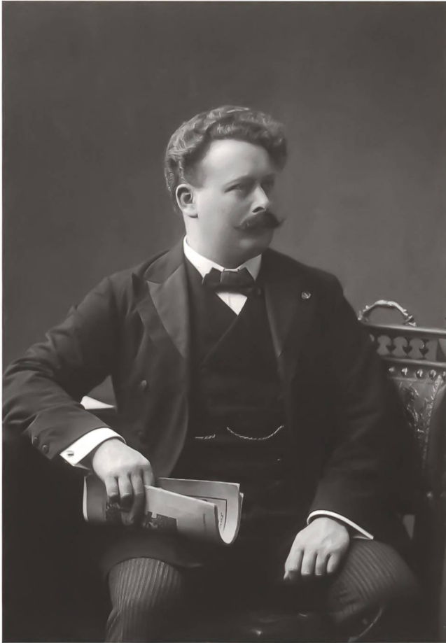
Willem Mengelberg 1905.

Zeitungen ausführlich berichtet. 6 Die Aufführung durch das Concertgebouw-Orchester unter Mengelberg vom 26. Oktober 1899 wurde durch das Publikum mit stürmischem Beifall begrüsst, obwohl es am 18. April während seiner dritten Erstaufführung unter Wüllner in Köln noch mit Zischen aufgenommen worden war. Die holländischen Kritiker reagierten teilweise aber auch skeptisch. Die Neue Rotterdamer Courant meinte, der Enthusiasmus des Publikums habe der Ausführung, nicht der Musik gegolten. 7 In Den Haag spielte das Orchester Ein Heldenleben erst ein halbes Jahr später, am 21. März 1900. Vor allem gab es Kommentare auf die grosse Besetzung: «Es war manchmal, als ob die Hölle offen stände, so'n Lärm!» 8