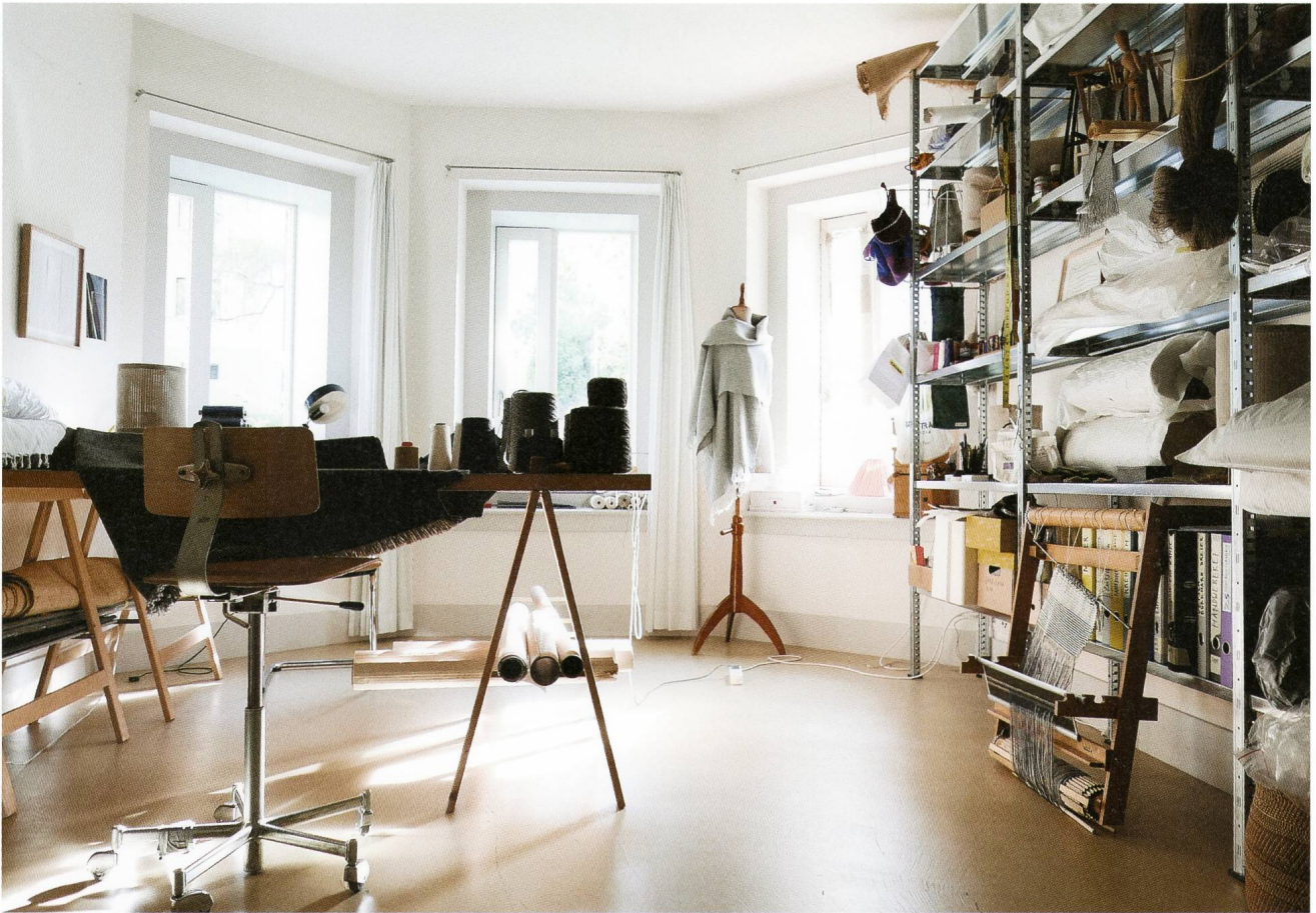
Blankes Handweberei in Chur.

lichen Bilderwelt das Attribut der Spindel. Wegen der sich gleichmässig drehenden resp. regelmässig wiederholenden Bewegung galten Spinnrad und Webstuhl als Symbol unabänderlicher Gesetzmässigkeit; aus ihnen ging im Volksglauben der Faden des Lebens, des Schicksals hervor. (Vgl. Manfred Lurker, Wörterbuch der Symbolik)