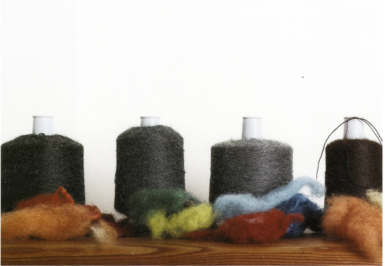
Alpaka-Wolle und pflanzengefärbte Schafwolle.

machte Blanke eine schöpferische Entwicklung durch, die sich von der Gestaltung komplexer Muster hin zu einer wohlüberlegten Auslotung einer grösstmöglichen Reduktion zeigte. Für Blanke bedeutete dieser Prozess eine Loslösung vom sich selbst auferlegten Drang nach Perfektion und Komplexität und mündete schliesslich in der Intention, Textilien zu kreieren, deren Charakteristik hauptsächlich darin besteht, mittels minimaler Eingriffe scheinbare Monotonie dennoch changieren zu lassen sowie eine schlichte Sinnlichkeit zu erzielen. Exemplarisch sollen hierfür zwei Schöpfungen Eva Blankes vorgestellt werden: Einmal wollene Schultertücher in den Farben Hellgrau, Anthrazit, Braun oder Beige, die sich dank des nachträglichen Walkens besonders weich an den Körper schmiegen; diese werden durch einen einzigen, in der Mitte angebrachten handgesponnenen sowie naturgefärbten roten Wollfaden geteilt und zugleich miteinander verbunden. Dann ein handgewobener Teppich, der