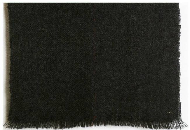
Schultertuch aus Baby Alpaka.