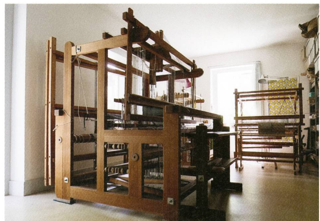
Blankes Handweberei in Chur.

Der kreative Prozess beginnt für Eva Blanke mit einer ersten Skizze auf Papier, es folgen kleinformatische Musterarbeiten bis hin zum fertigen Produkt: Teppiche, Bettüberwürfe, Tücher, Schals, Ponchos oder auch Leinentaschen sowie Leuchten. Dabei ist es für sie zentral, für ihre Arbeiten ausgewählte naturbelassene sowie