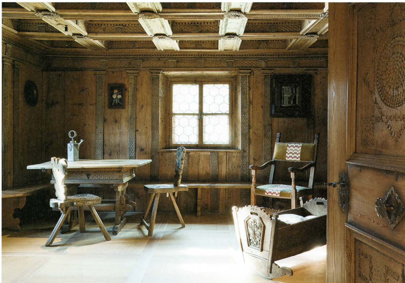
Höhepunkt der Dauerausstellung bilden die zehn so genannten historischen Zimmer, die bis zu 500 Jahre alt sind. Diese prunkvolle, 1691 datierte Stube aus Mesocco gehörte einst der Familie a Marca.