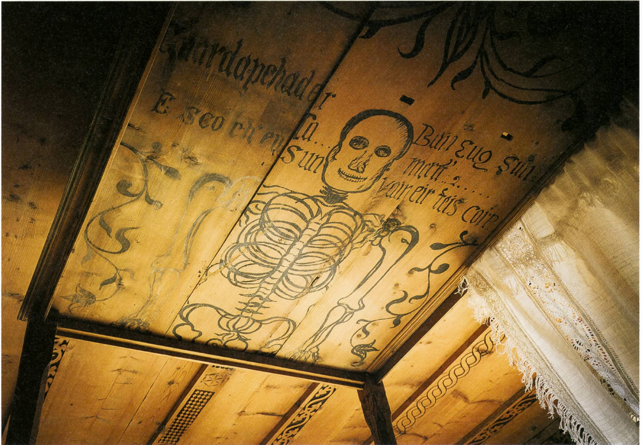
Auf der Unterseite des Betthimmels in der Tgombra da Parsonz befindet sich ein gemaltes Skelett mit romanischer Inschrift – ein so genanntes Memento mori. Es erinnert die Lebenden an den unausweichlichen Tod und ermahnt sie zu einem gottesfürchtigen Leben.