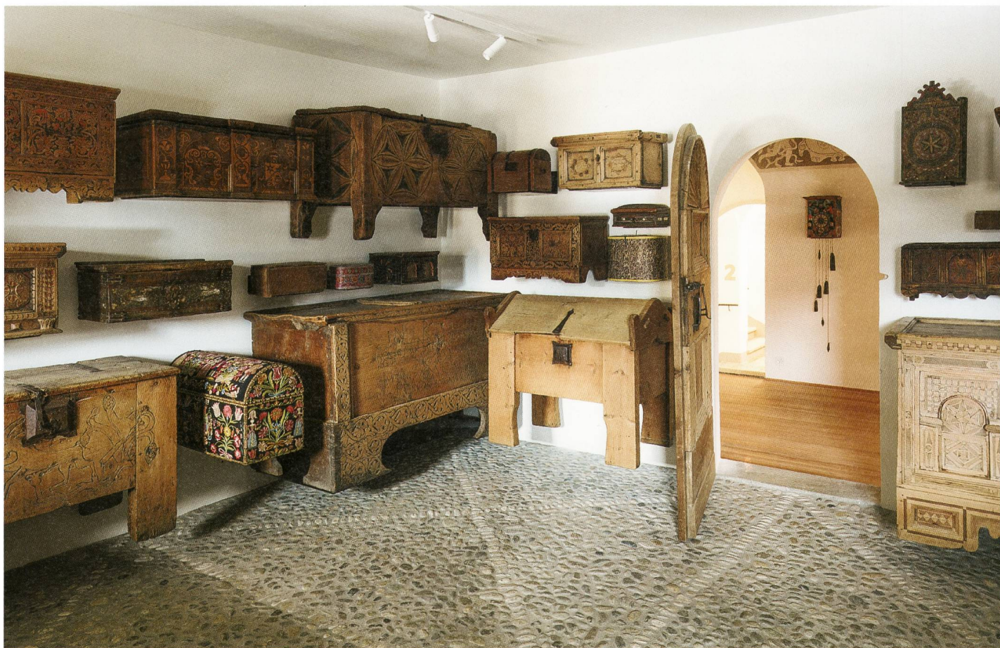
43 Truhen und Schatullen zeigen in einem der Schausammlungsräume die grosse Vielfalt an Behältnismöbeln und ihre teilweise aufwendigen Schnitzereien und Dekorationen.

Seither weht ein neuer Wind durch die alten Gemäuer. Werfen wir einen Blick auf einzelne dieser Räume: In der «Stüva da Brail» sind Geräte ausgestellt, die mit der Herstellung von Textilien in Zusammenhang stehen, während die städtisch anmutende «Stüva da Susch» aus dem Jahre 1811 über das Wappen auf dem zentralen Deckenmedaillon eine gewisse Familie Bonorand benennt. Der E-Guide verrät, um wen es sich dabei handelt: «Die Familie dieses Namens, die bei ihrer Rückkehr städtische Wohnkultur ins Hochtal brachte, betrieb im 19. Jahrhundert ein Kaffeehaus in Leipzig». Betreten wir danach die «Stüva