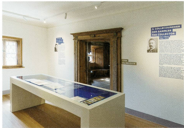
Ein Raum widmet sich Museumsgründer und Sammler Riet Campell sowie dem Architekten des Museums, Nicolaus Hartmann jun.

Dieser E-Guide ist ein umfassender Katalog. Damit können Kinder wie Erwachsene unabhängig voneinander durch die Ausstellung flanieren. Er vermittelt in Wort und Bild und Ton, was im Haus zu sehen und wie es im historischen, kunst-