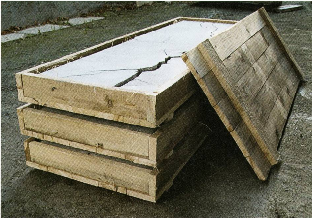
Grosser Riss oder Athanagoras archeologische Richtlinie, 2007, dreiteilig, Betonguss, Holzkisten je 145 x 45 x 10 cm.

melsurium seiner Arbeiten beherbergt. Kommt man mit Zehnder während eines Atelierbesuchs ins Gespräch, wird rasch ersichtlich, dass der Künstler sehr wohl eine klare wie auch besonnene Intention mit seinem Kunstschaffen verfolgt: Subtil thematisiert er die vordergründig unscheinbare Einflussnahme des Menschen auf den Lauf der Zeit.