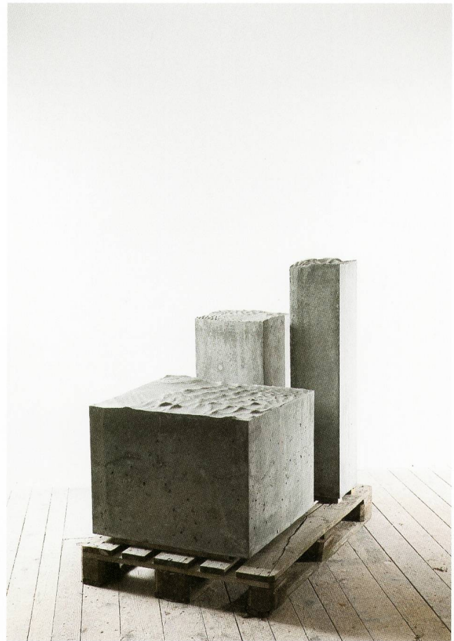
Wassersäulen, 2012, dreiteilig, Betonguss, 80 x 120 x 102 cm, Hamilton Ems AG.