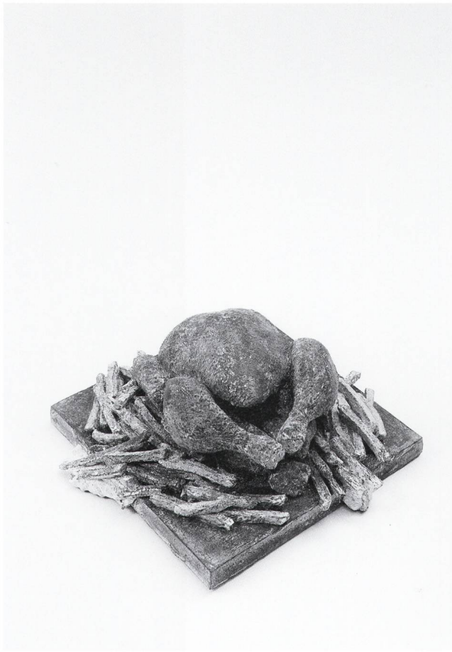
Poulet & Pommès, 2014. Aus der Werkgruppe «food waste», Betonguss, 25 x 25 x 12 cm.