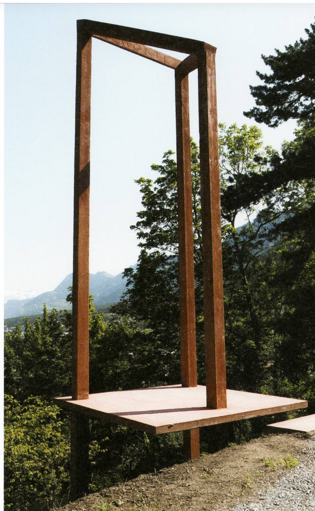
Schaugerüst, 2019. Parkanlage Rosenhügel Chur. Betonguss rot eingefärbt, 520 x 170 x 170 cm.

grub sie für einige Zeit in seinem Garten. In den in barocker Opulenz gehaltenen Stilleben wie auch in den Grabtüchern, die an das sagenumwobene Turiner Grabtuch erinnern, tradiert Zehnder die Vanitassymbolik in einen aktuellen Kontext.