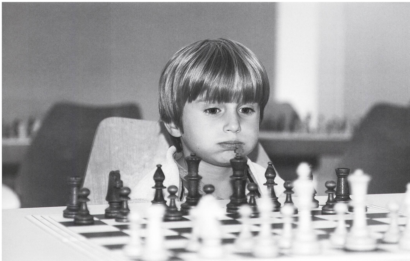
Junger Kiebitz beim Rahmenprogramm am Mitropacup 2010 in Chur.

24 besten Clubs der Schweiz. Ein solches Hoch blieb auch von der Stadtregierung nicht unbenutzt. Zweimal – 2016 und 2018 – ehrte der Stadtrat Spieler für ihre Erfolge. Peter A. Wyss hatte inzwischen im Schweizerischen Schachbund die Leitung des Herren-Kaders übernommen und wurde 2015 zum Zentralpräsidenten gewählt.