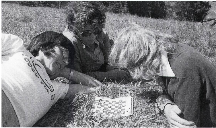
1970–1980: Auch bei Maiensässfahrten war Schach ein gern gespielter Zeitvertreib.