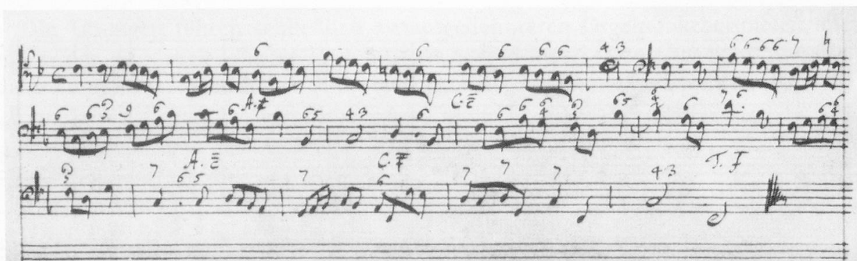
Bsp. 20: (nach: G. F. Händel, Aufzeichnungen zur Kompositionslehre , a.a.O., S. 481).

Die dritte Übung dieser Art ist länger; sie enthält zwei Durchführungen, und von diesem Punkt des Lehrgangs an fügt Händel zu der Aufgabe jeweils ein ausgeführtes Beispiel als Illustration der betreffenden Studienphase hinzu. Die zweite Fugendurchführung erfordert eine typische Unterbrechung der vollstimmigen Faktur, damit die jeweils neuen Einsätze verdeutlicht werden. Das Prinzip ist in Händels Beispiel erläutert, das dieselbe Tonart und Struktur aufweist und aus dessen Thema er wiederum dasjenige der nächsten Aufgabe ableitet (Bsp. 20, 21, 22).