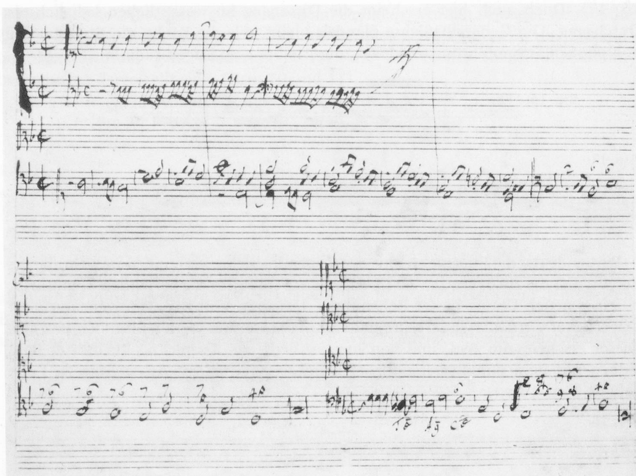
Bsp. 18 und 19: (nach: G. F. Händel, Aufzeichnungen zur Kompositionslehre = Hallische Händel-Ausgabe, Suppl., Bd. 1, S. 45).

Die dritte Übung dieser Art ist länger; sie enthält zwei Durchführungen, und von diesem Punkt des Lehrgangs an fügt Händel zu der Aufgabe jeweils ein ausgeführtes Beispiel als Illustration der betreffenden Studienphase hinzu. Die zweite Fugendurchführung erfordert eine typische Unterbrechung der vollstimmigen Faktur, damit die jeweils neuen Einsätze verdeutlicht werden. Das Prinzip ist in Händels Beispiel erläutert, das dieselbe Tonart und Struktur aufweist und aus dessen Thema er wiederum dasjenige der nächsten Aufgabe ableitet (Bsp. 20, 21, 22).