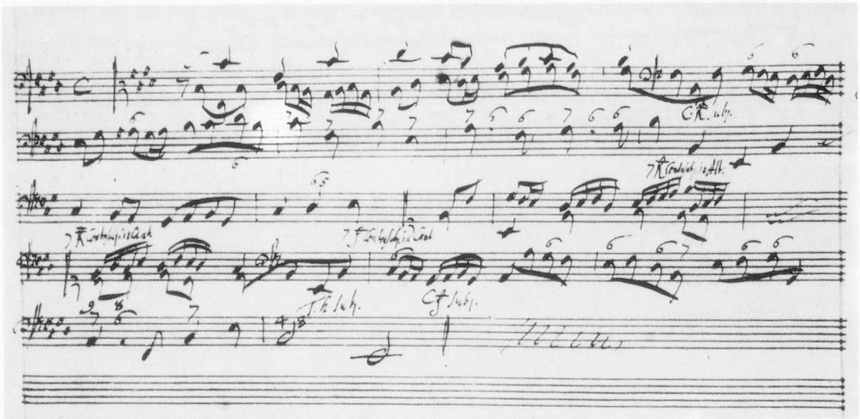
Bsp. 24: (nach: G. F. Händel, Aufzeichnungen zur Kompositionslehre , a.a.O., S. 51).

In den letzten beiden Aufgaben verlangt Händel schließlich einen Generalbaßsatz in Doppelfugenexposition (Bsp. 23, 24). Es handelt sich um zwei Typen der Doppelthematik. Im ersten Fall sind die beiden Themen rhythmisch und melodisch klar voneinander unterschieden; im zweiten, komplizierteren, bezieht sich die Unterscheidung nur auf die Notenwerte, während die lineare Gestalt des Gegen-themas offensichtlich aus der des Hauptthemas entwickelt wird. Beide Aufgaben werden wieder durch Händels eigene Beispiele ergänzt (Bsp. 25, 26).