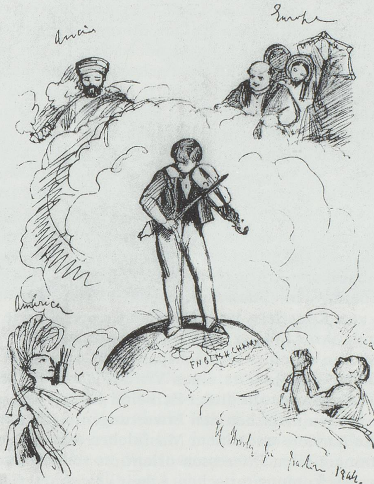
Bild 1: Joseph Joachim auf der Weltkugel, Stammbuchzeichnung von John Callcott Horsley 1844 (London, British Library).

Ein Knabe steht geigespielend auf der Weltkugel, um ihn die Erdteile Afrika, Asien, Europa, Amerika. Europa ist durch eine bürgerliche Familie dargestellt, während die anderen Kontinente durch Ureinwohner symbolisiert werden. Alle lauschen dem Knaben, der mit beiden Beinen auf englischem Boden steht und auf Amerika herabsieht. 1