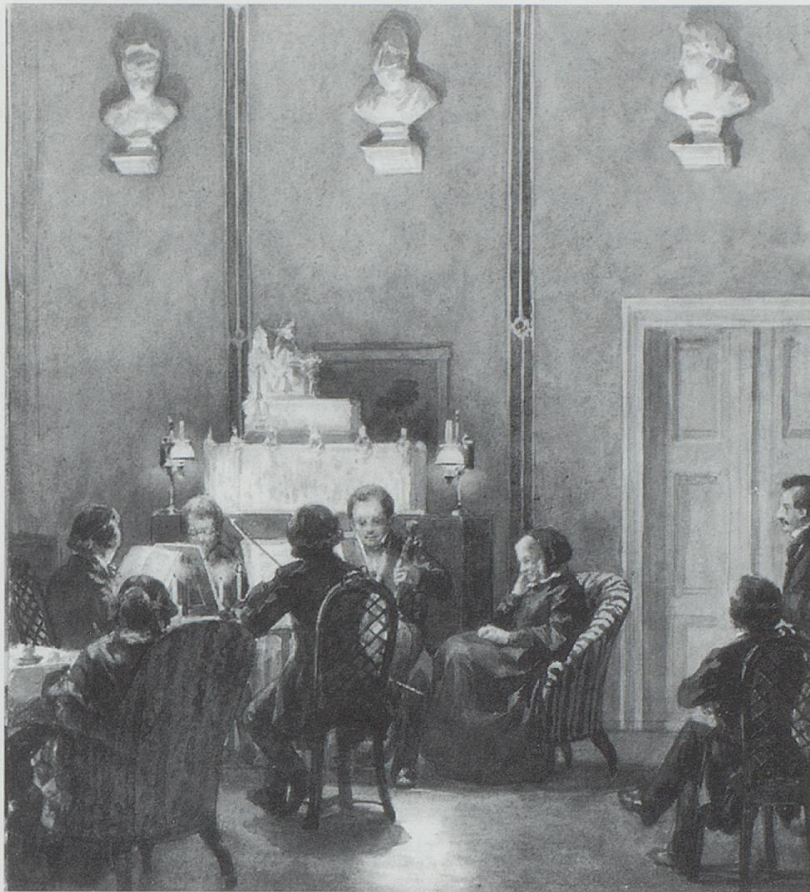
Bild 2: Quartettabend bei Bettine, Aquarell von Carl Johann Arnold 1854/56 (Frankfurt/M., Freies Deutsches Hochstift – Frankfurter Goethe-Museum) 2

Konzert bis zum intimen Vierhändigspielen im häuslichen Kreis. 3 Arnolds Bild wirkt auf den ersten Blick wie eine Momentaufnahme von einem privaten Quartettabend. Man glaubt fast, die Musik, die da gespielt wird, hören zu können. Bestimmend für den Gesamteindruck des Bildes: die Lichtverhältnisse. Während die Quartettspieler und die wenigen Zuhörer im Halbdunklen sitzen, fällt das Licht auf eine Art Altar, der im Hintergrund des Raumes aufgebaut ist, und auf drei antike Büsten, die von der Höhe des Raumes auf das Quartett hinabschauen. Die Musiker scheinen mitten im Spiel, alle blicken in die beleuchteten Noten. Nur das Gesicht des Cellisten ist zu erkennen. Der Primgeiger dagegen wendet uns den