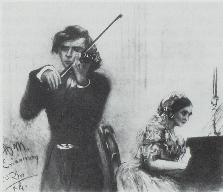
Bild 3: Clara Schumann und Joseph Joachim, Adolph Menzel 1854 (Zwickau, Robert Schumann-Haus)