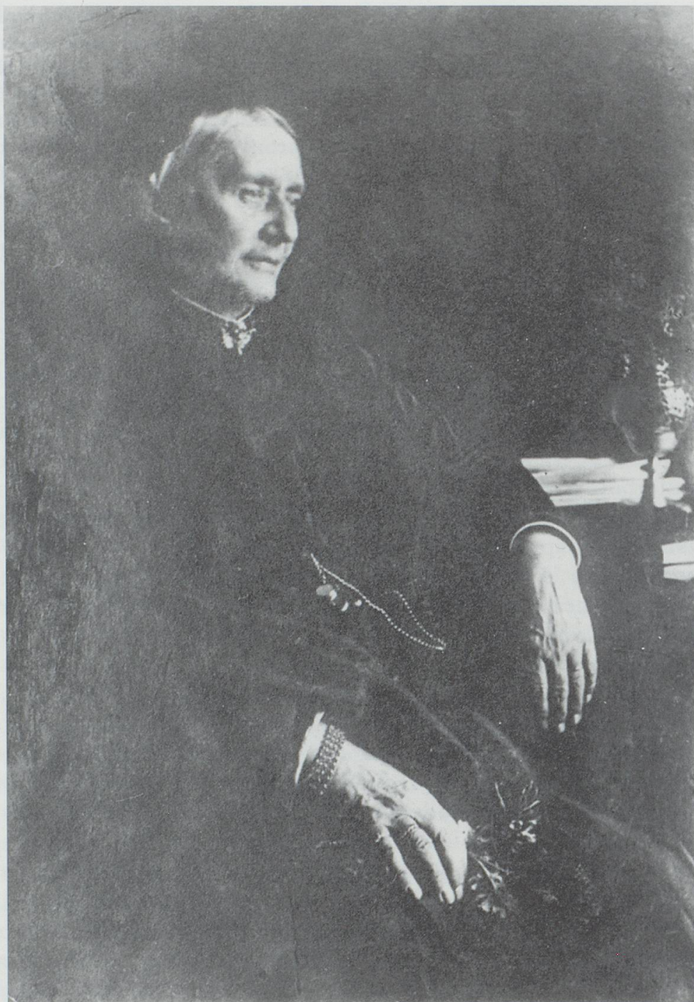
Bild 10: Clara Schumann im Alter