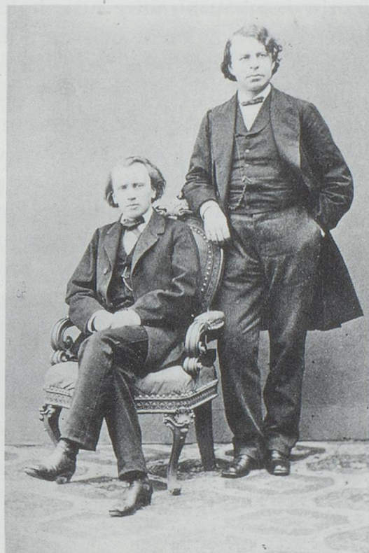
Bild 8: Photographie: Joseph Joachim und Johannes Brahms 1867 (Göttingen, Privatbesitz)

Ach, warum soll ich Dir's nicht sagen, meine liebe einzige Freundin, mehr als je fühle ich oft Zweifel, ob ich zum schaffenden Künstler geboren, ob meine ganze Natur nicht eine so schwerfällige sei, die sich begnügen sollte zu verstehen, und in sich aufzunehmen, was andere Köstliches biethen. Alle meine Arbeiten erscheinen mir oft so mühsam, unfrei, kummervoll, peinlich – statt erquickend freudigen Muth auszuströmen. O, ich ahne sie wohl, jene glückliche, beschwing-