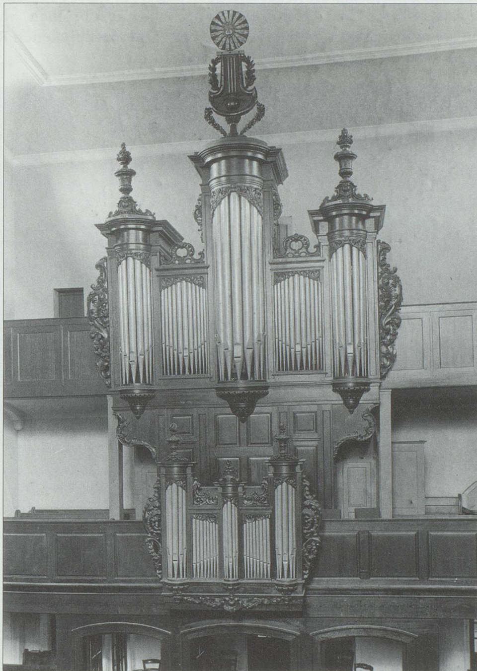
Abb. 1: Bouxwiller, Evangelische Kirche: Die Silbermann-Orgel von 1778. Aufnahme von ca. 1960. Die hier sichtbare Bekrönung des Mittelturms wurde 1812 an Stelle des in der Revolutionszeit entfernten herrschaftlichen Wappens angebracht. Inzwischen wurde letzteres rekonstruiert.

Möglicherweise wurde die Cimbale im Manual in dreifacher statt in zweifacher Besetzung ausgeführt. Darauf deutet die dem Originaltext im Silbermann-Archiv von anderer Hand beigegefügte Disposition hin. 12