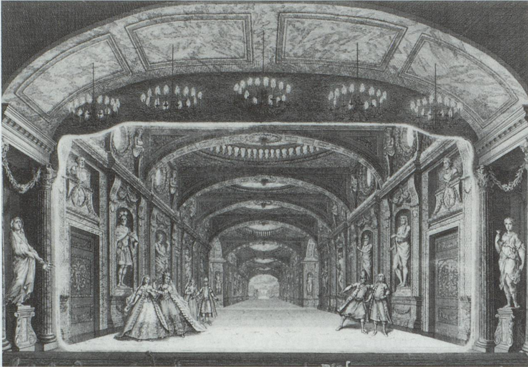
Abb. 1: Gerard de Lairese, De aloude Hofgallerij, Theater Amsterdam 1681. Stich von A. van der Laan, um 1768. Amsterdam, Sammlung Theater Instituut Nederland.