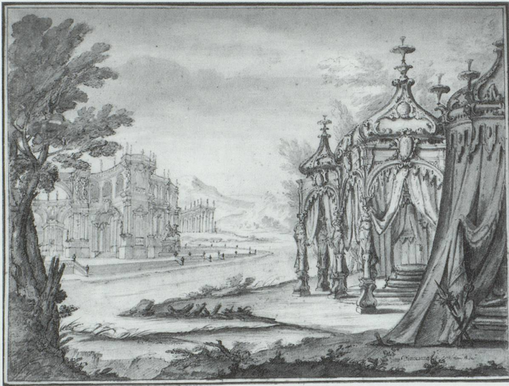
Abb. 4: Vincenzo dal Re: Entwurf, wahrscheinlich für die Oper Alessandro nell’Indie (Musik: D. Sarro, Text: P. Metastasio) angefertigt, die 1743 in Neapel uraufgeführt wurde. London, Sammlung des Royal Institute of British Architects, RIBA.

lautet: „Gran padiglione d’Alessandro vicino all’ Idaspe. Vista della reggia di Cleofide su l’altra sponda del fiume“ – „Ein grosses Zelt Alexanders nahe dem Hydaspes. Ansicht mit der Burg der Cleophide am andern Ufer des Flusses.“ Der Entwurf betrifft wahrscheinlich die gleichnamige Oper von Domenico Sarro, die 1743 im Teatro San Carlo in Neapel aufgeführt wurde. 38