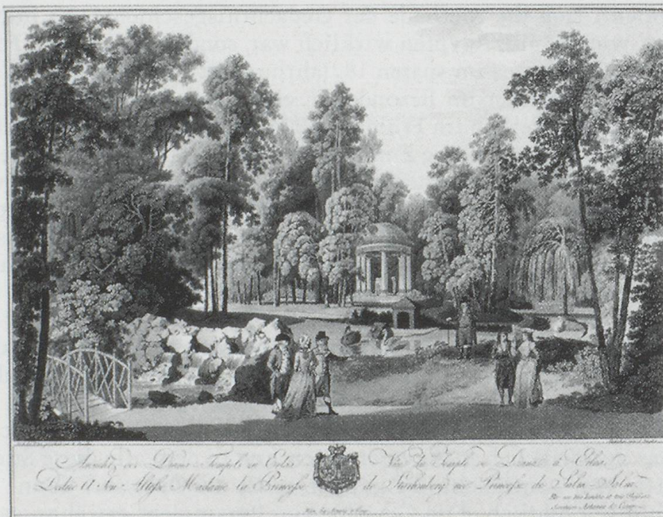
Abb. 1: Diana-Tempel von Erlaa, kolorierte Radierung von Johann Ziegler aus dem Anfang des 19. Jahrhunderts. 3

Der Rundtempel im Hintergrund, den wir auf vielen der frühen Bühnenbildentwürfe sehen, findet sich genau so in den Parks etwa von Wörlitz, Erlaa und Waldegg.